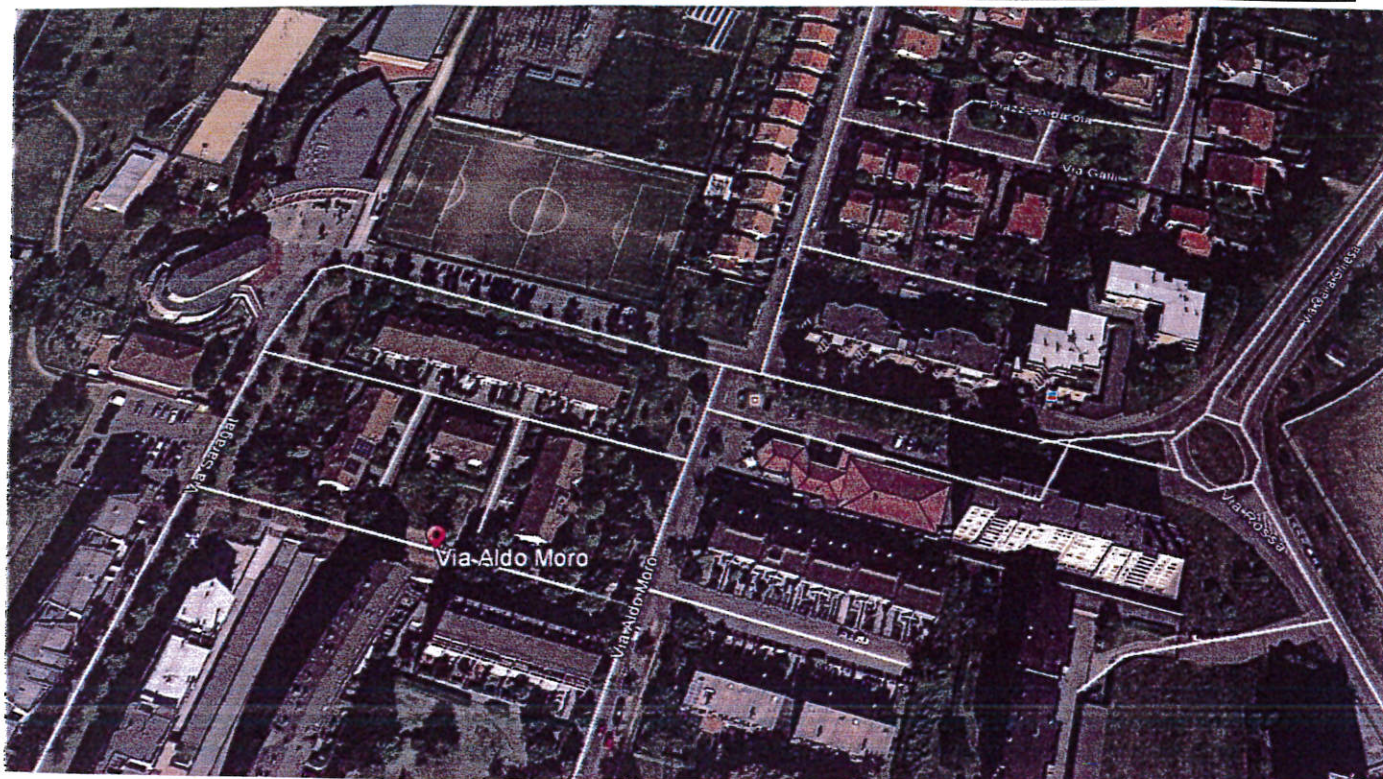
AREA DI PROPRIETA' COMUNALE VIA A. MORO, LODI

PERIZIA DI STIMA DELLA SCHEDA N. 8 DEL PIANO DELLE ALIENAZIONI E VALORIZZAZIONI DEL PATRIMONIO IMMOBILIARE DI PROPRIETA' COMUNALE. ANNO 2015.