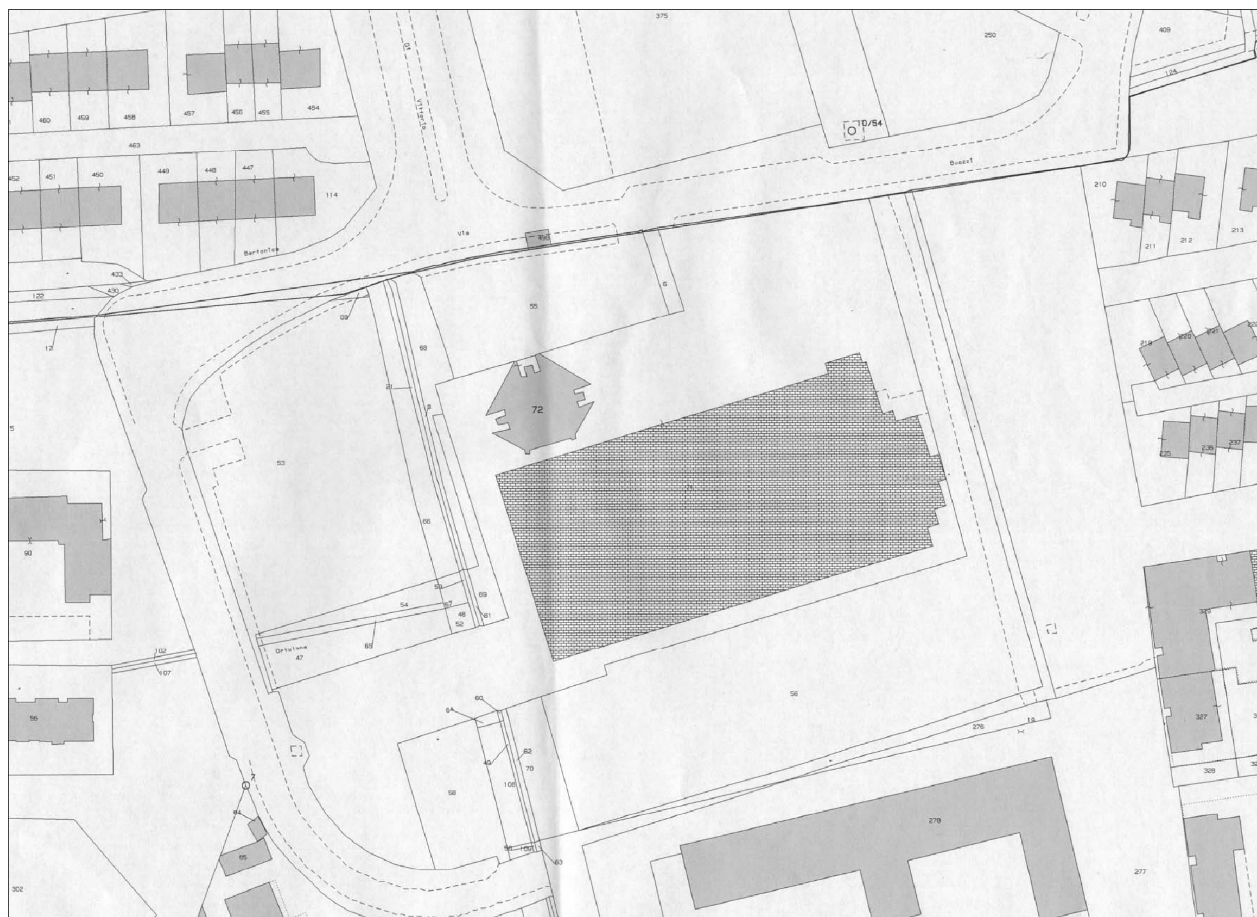
Estratto di planimetria catastale, foglio 55, particella 72 scala 1:1000