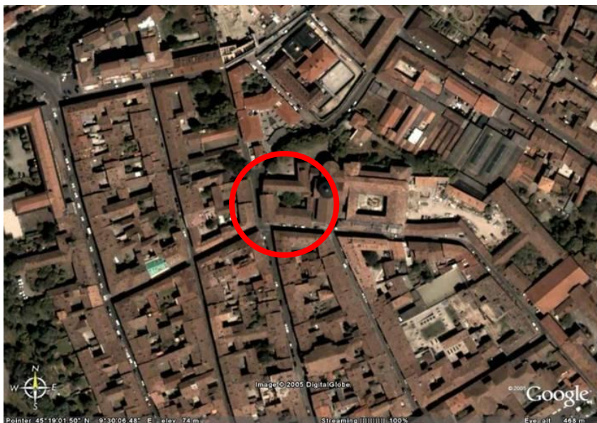
Fotografia aerea dell'area