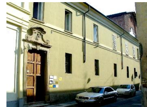
Foto edifici e/o posizione punti di misura