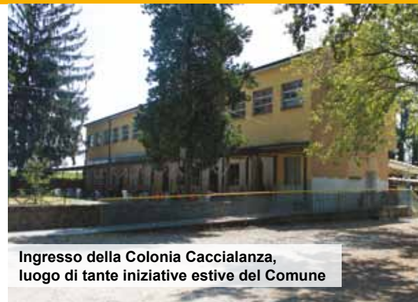
Ingresso della Colonia Caccialanza, luogo di tante iniziative estive del Comune

Ma non solo i giovanissimi hanno popolato