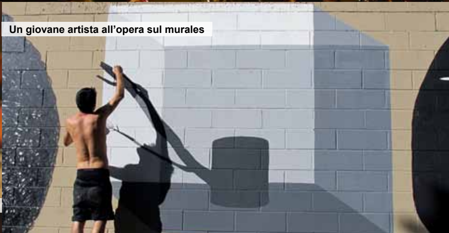
Un giovane artista all'opera sul murales