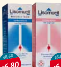
Lisomucil (con/senza zucchero) sciroppo adulti e bambini