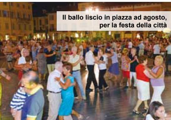
Il ballo liscio in piazza ad agosto, per la festa della città

accolto l'appello lanciato dal Comune. "Lodi al Sole", il tradizionale contenitore organizzato nei mesi di giugno luglio e agosto, ha suscitato partecipazione ed interesse: molti gli eventi affollati, a partire dalla Notte Bianca del 28 luglio, dalla