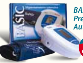
BASIC Apparato Pressione Safety Automatico