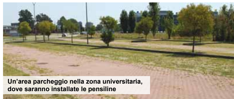
Un'area parcheggio nella zona universitaria, dove saranno installate le pensiline

Tre nuovi impianti, oltre 400 i posti auto coperti dai pannelli