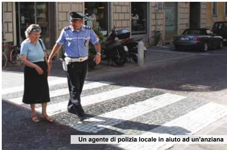
Un agente di polizia locale in aiuto ad un'anziana

Il progetto di Lodi è primo in Lombardia