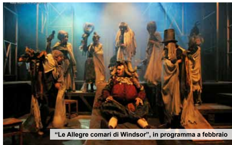
"Le Allegre comari di Windsor", in programma a febbraio