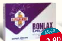
Bonlax microclismi adulti