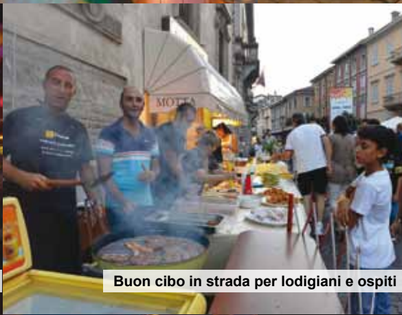
Buon cibo in strada per lodigiani e ospiti