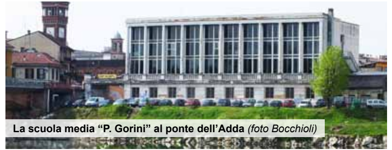
La scuola media "P. Gorini" al ponte dell'Adda

Grazie ad un finanziamento del Ministero viene migliorata la qualità dell'edificio