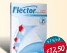
Flector 5 cerotti