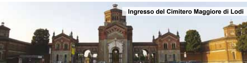
Ingresso del Cimitero Maggiore di Lodi

Ampliamenti e nuove realizzazioni programmati nei prossimi anni