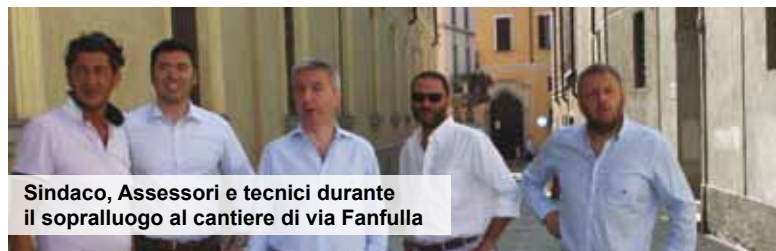
Sindaco, Assessori e tecnici durante il sopralluogo al cantiere di via Fanfulla

Ogni quartiere è coinvolto dalle operazioni