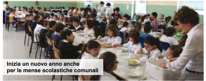
Inizia un nuovo anno anche per le mense scolastiche comunali

Aumenti del 20% per equilibrare i conti e coprire parte dell'inflazione