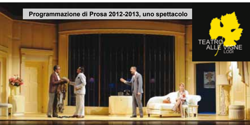
Programmazione di Prosa 2012-2013, uno spettacolo

Prosa, cabaret, concerti, teatro per famiglie e due spettacoli in prima nazionale