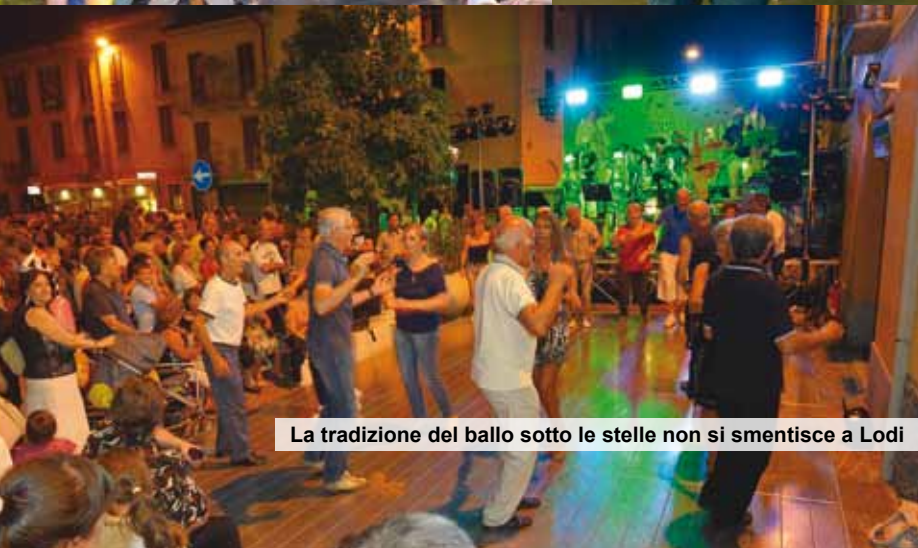
La tradizione del ballo sotto le stelle non si smentisce a Lodi