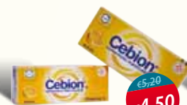
Cebion Arancia cpr effervescenti e masticabili