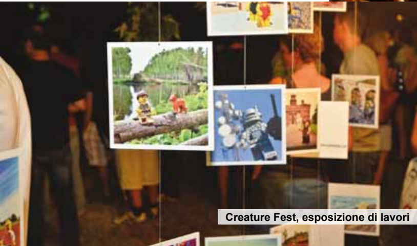
Creatures Fest, esposizione di lavori