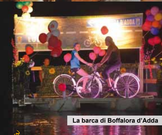
La barca di Boffalora d'Adda