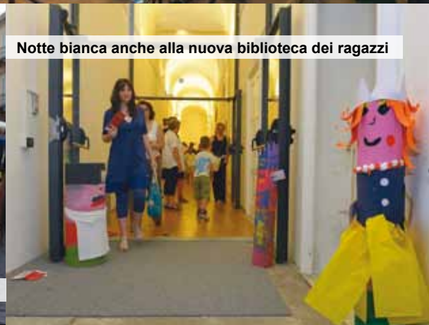
Notte bianca anche alla nuova biblioteca dei ragazzi