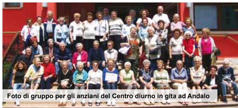
Foto di gruppo per gli anziani del Centro diurno in gita ad Andalo

L'ingresso è stato spostato da via Gorini a Via Carducci, a motivo dei lavori che il Comune sta effettuando per realizzare il nuovo Asilo Giardino, ma per chi entra al Centro Diurno Anziani l'atmosfera che si respira è sempre la stessa: un clima di amicizia, di simpatia, di attenzione alle persone ed ai loro bisogni, da quelli più semplici a quelli complessi. I dipendenti e alcuni volontari del Comune di Lodi gestiscono da anni con successo, senza clamore e con quotidiana pazienza, uno dei luoghi della città dove maggiormente si percepisce la cura in favore della "terza età" che, come noto, a Lodi rappresenta una percentuale assai alta di popolazione. Al Centro si ritrovano ogni giorno, dal lunedì al venerdì dalle 8.30 alle 17.00, un buon numero di persone, che raggiunge il centinaio circa nelle grandi occasioni quali feste, ricorrenze, giornate di gita fuori città. Quest'anno si è fatto tappa ad Andalo dal 30 giugno al 14 luglio: in 98 hanno goduto del fresco, dell'ospitalità e della buona organizzazione degli operatori dell'Agenzia Brenta Viaggi, che supporta da 15 anni il Centro. Sono però circa 35-40 le presenze degli anziani al Centro in una 'giornata tipo', che usufruiscono dei servizi messi a