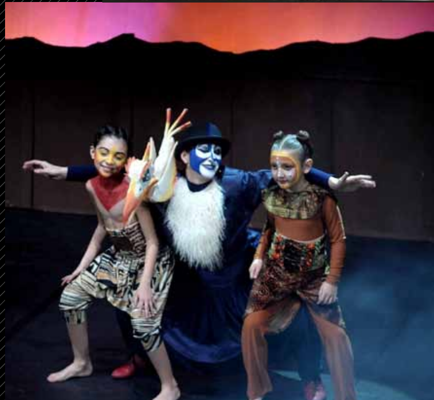
"VIAGGIO NEL CERCHIO DELLA VITA"

direzione teatrale di Agostino Dalcerci; direzione musicale di Michele Fontana