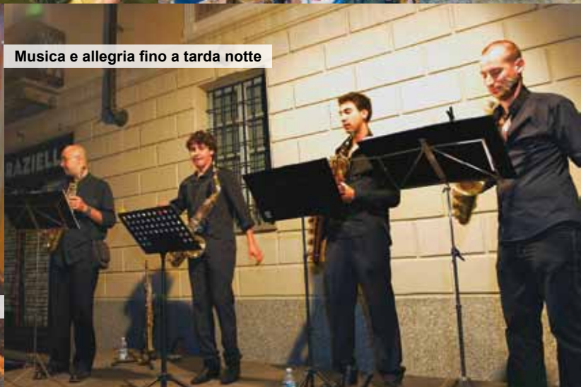
Musica e allegria fino a tarda notte