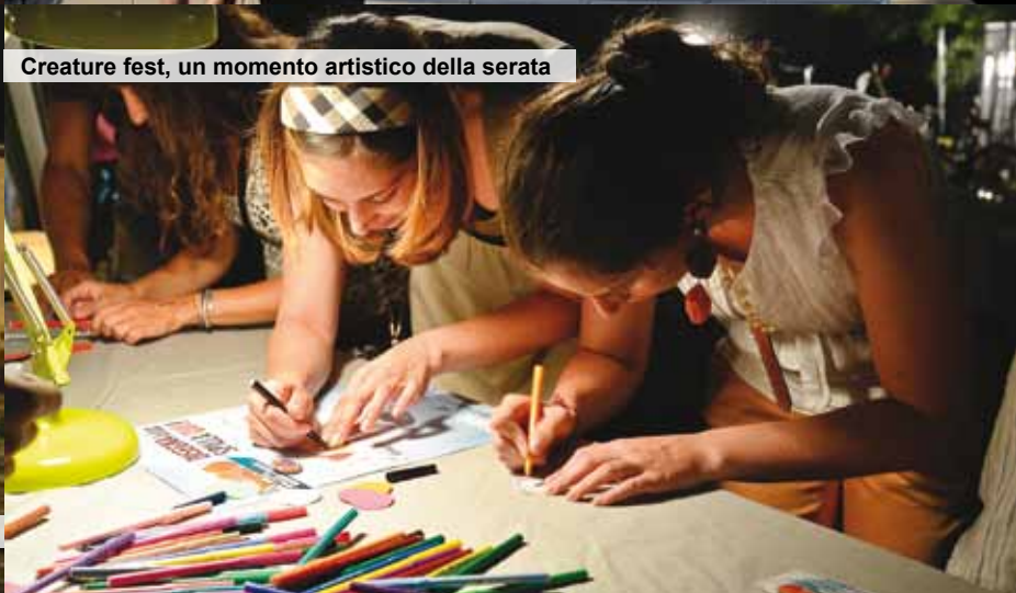
Creatures fest, un momento artistico della serata