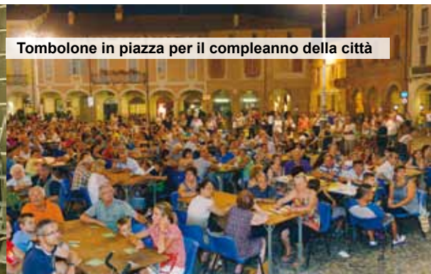
Tombolone in piazza per il compleanno della città