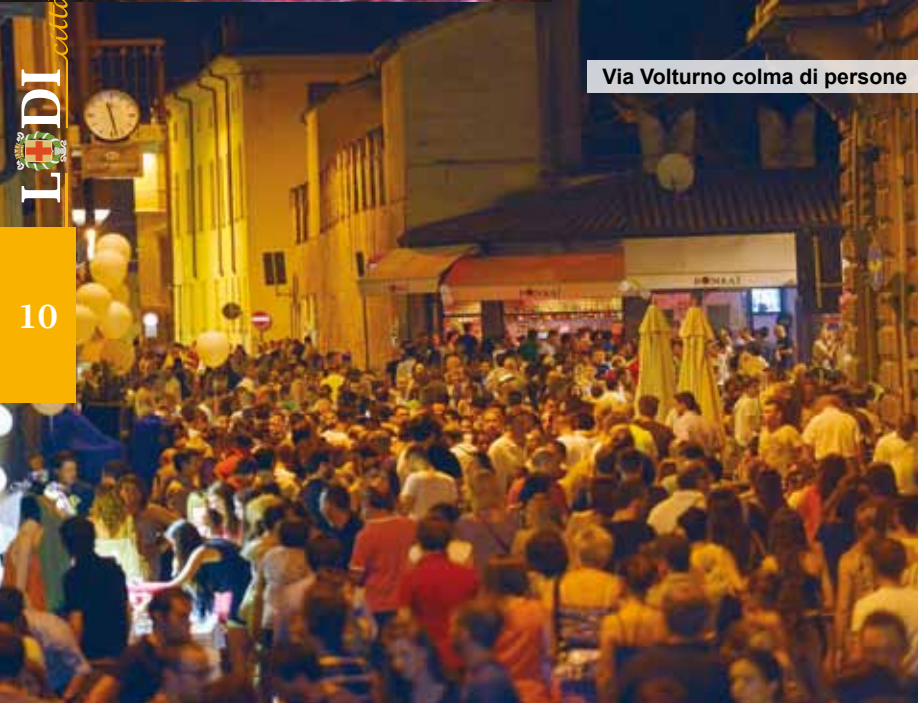
Via Volturno colma di persone