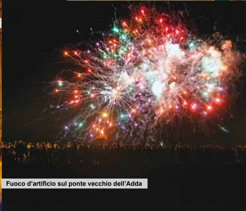
Fuoco d'artificio sul ponte vecchio dell'Adda