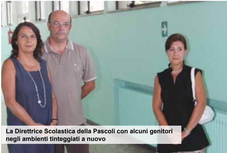
La Direttrice Scolastica della Pascoli con alcuni genitori negli ambienti tinteggiati a nuovo

A Lodi interessanti esperienze di collaborazione con le Direzioni didattiche e il Comune