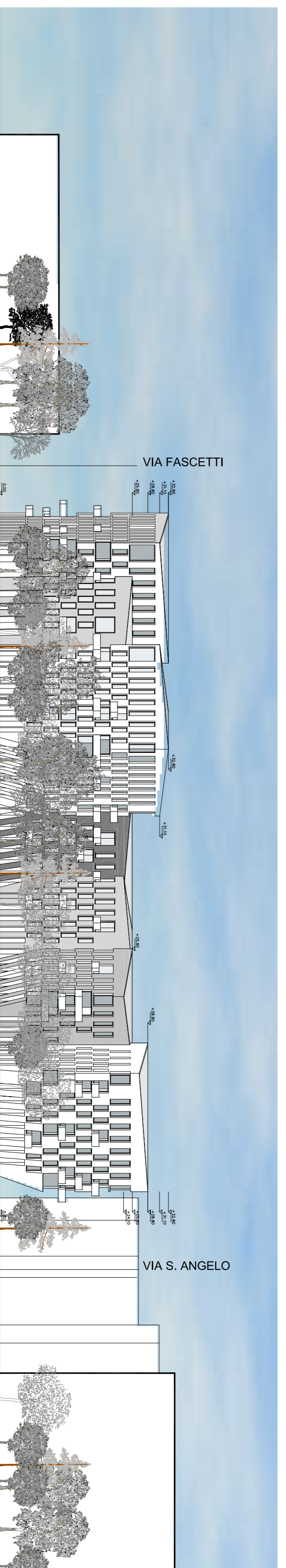
PROSPETTI VIALE PAVIA