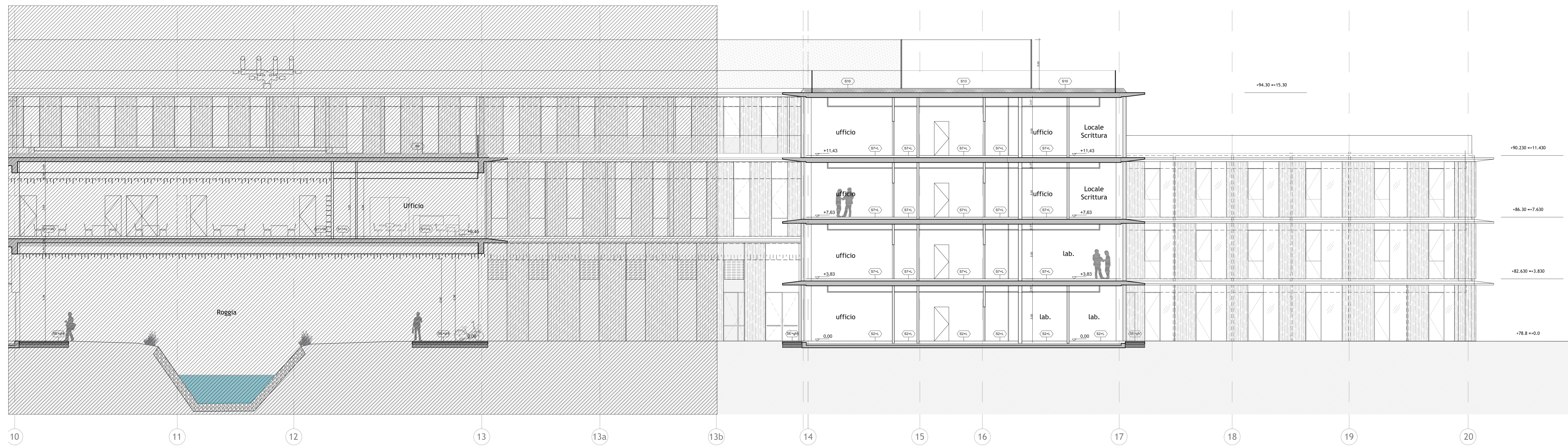
Sezione longitudinale 2