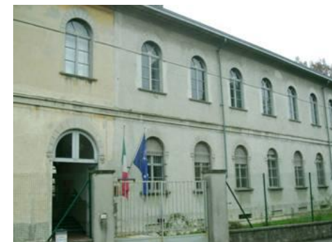
Foto edifici e/o posizione punti di misura