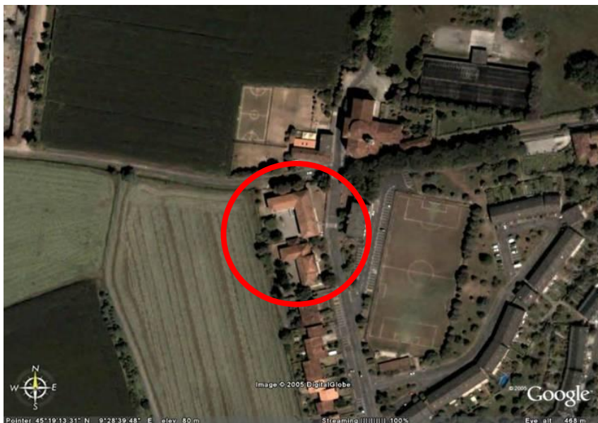
Fotografia aerea dell'area