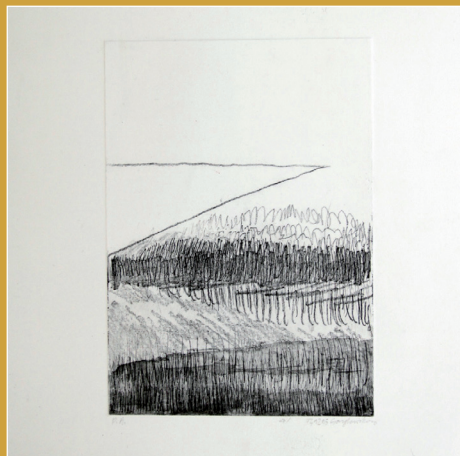
Paesaggi inconsapevoli, stampa a cera molle aquatinta, puntasecca su carta spina

Nasce a Shenzhen, Cina, nel 1994. Dimostra sin da molto giovane un forte interesse verso l'arte e comincia parallelamente con lo studio della musica e della pittura. Dopo aver conseguito il diploma artistico al liceo Binhe di Shenzhen, nel 2013 si sposta in Italia a Milano e comincia a frequentare il corso di Decorazione presso l'Accademia di Belle Arti di Brera a Milano. In questo periodo ha la possibilità di conoscere e sperimentare una serie di linguaggi che entreranno a far parte del suo bagaglio culturale. La sua ricerca artistica si articola così con un'ampia gamma di linguaggi che includono la fotografia, il video, il suono, l'installazione, la scultura e la pittura. Attualmente il suo lavoro si sviluppa attraverso un'indagine sulla relazione tra l'uomo e la realtà e tra le sue dimensioni, interiore ed esteriore. Vive e lavora a Milano dove ha partecipato a varie mostre collettive.