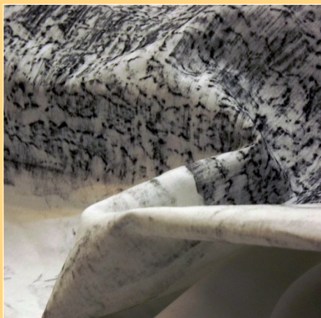
Skin: sulla metamorfosi, frottage, carboncino su tela