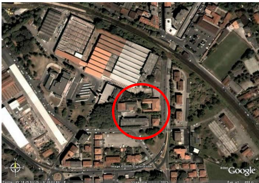
Fotografia aerea dell'area