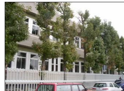
Foto edifici e/o posizione punti di misura