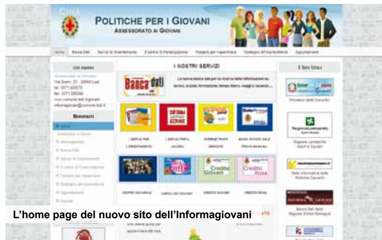
L'home page del nuovo sito dell'Informagiovani

Scuola e mondo del lavoro al centro dell'attenzione