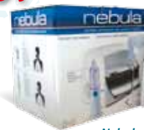
Nebula aerosol + doccia nasale