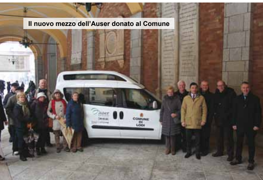
Il nuovo mezzo dell'Auser donato al Comune