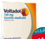
Voltadol 5 cerotti