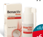
Benactiv Gola spray