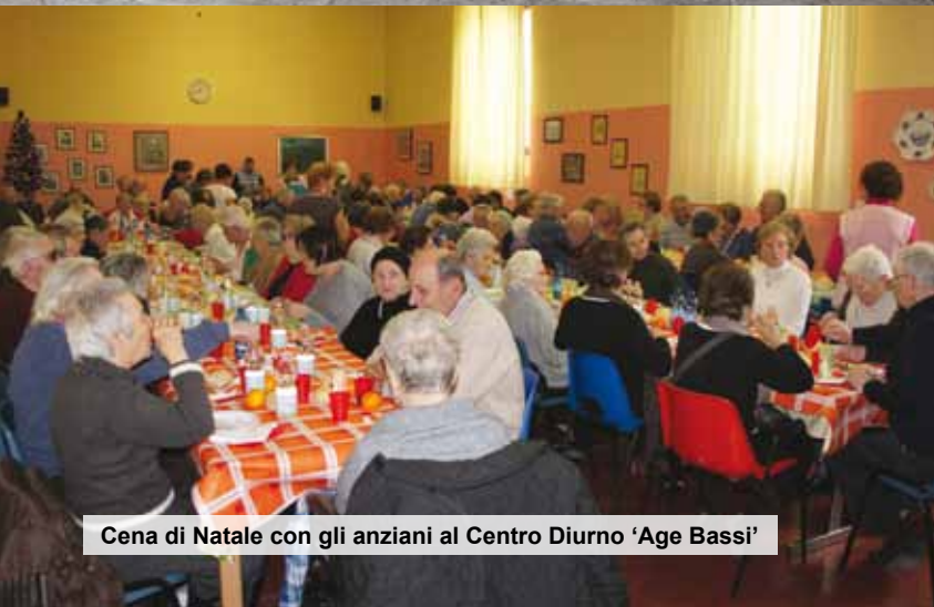
Cena di Natale con gli anziani al Centro Diurno 'Age Bassi'