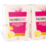
Tachifludec buste limone e miele - limone