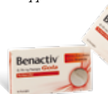
Benactiv Gola pastiglie arancia - limone e miele