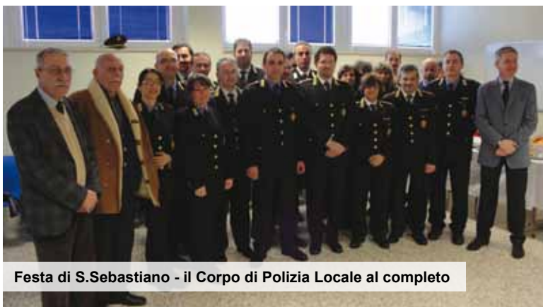
Festa di S. Sebastiano - il Corpo di Polizia Locale al completo

In questo modo il Comune agisce lungo molti degli assi che concorrono allo sviluppo della mobilità elettrica locale, seguendo le direttive promosse dal CEI-Cives (Comitato Elettrotecnico Italiano) per le Amministrazioni: oltre alle politiche di regolamentazione degli accessi alla ZTL che privilegiano veicoli elettrici e all'adozione in futuro di un piano regolatore nell'edificazione di nuovi condomini che preveda l'obbligo di installare punti di ricarica, da qualche mese è già stato inaugurato il car sharing elettrico e sviluppati sistemi di scambio intermodale, favoriti dai nuovi servizi di ciclofficina, bicistazione e bike sharing ubicati nei pressi della stazione ferroviaria.