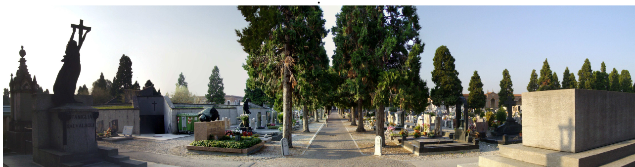
2. Cimitero Maggiore, vista interna dall'ingresso principale.