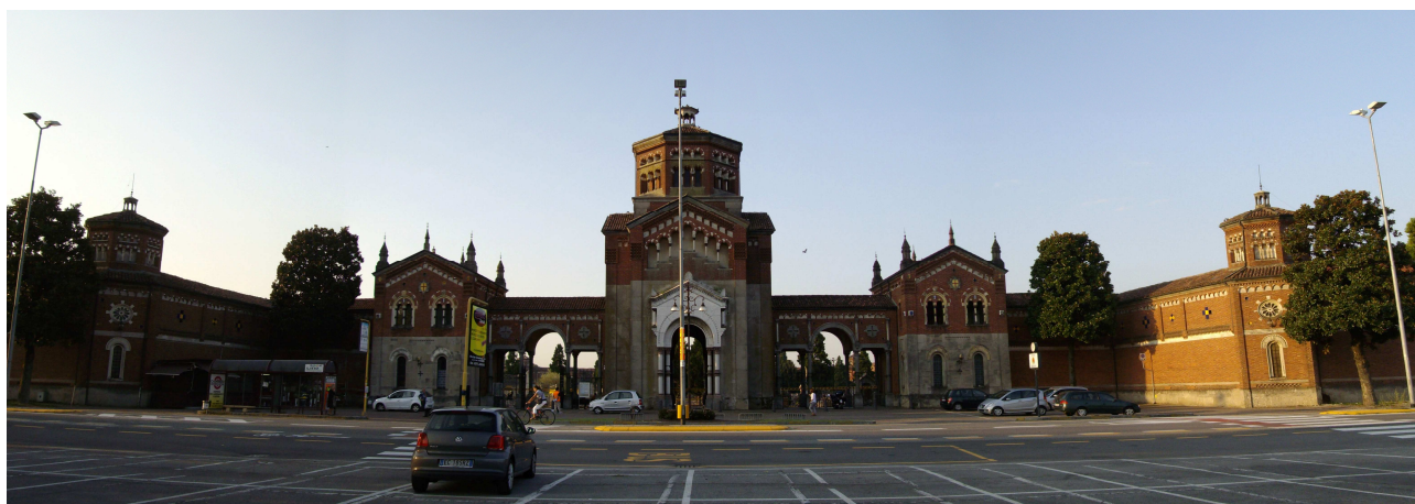
1. Cimitero Maggiore, vista ingresso.