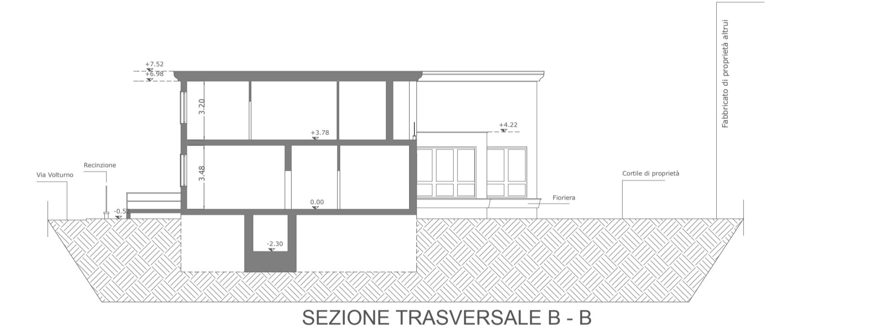
Calcolo del Volume geometrico ai sensi dell'art. 28 NTA del PGT