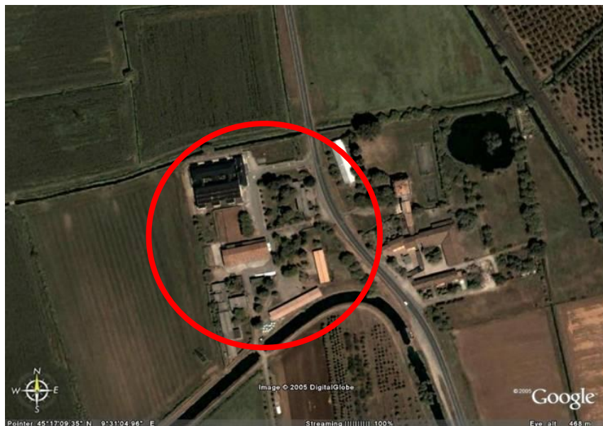
Fotografia aerea dell'area