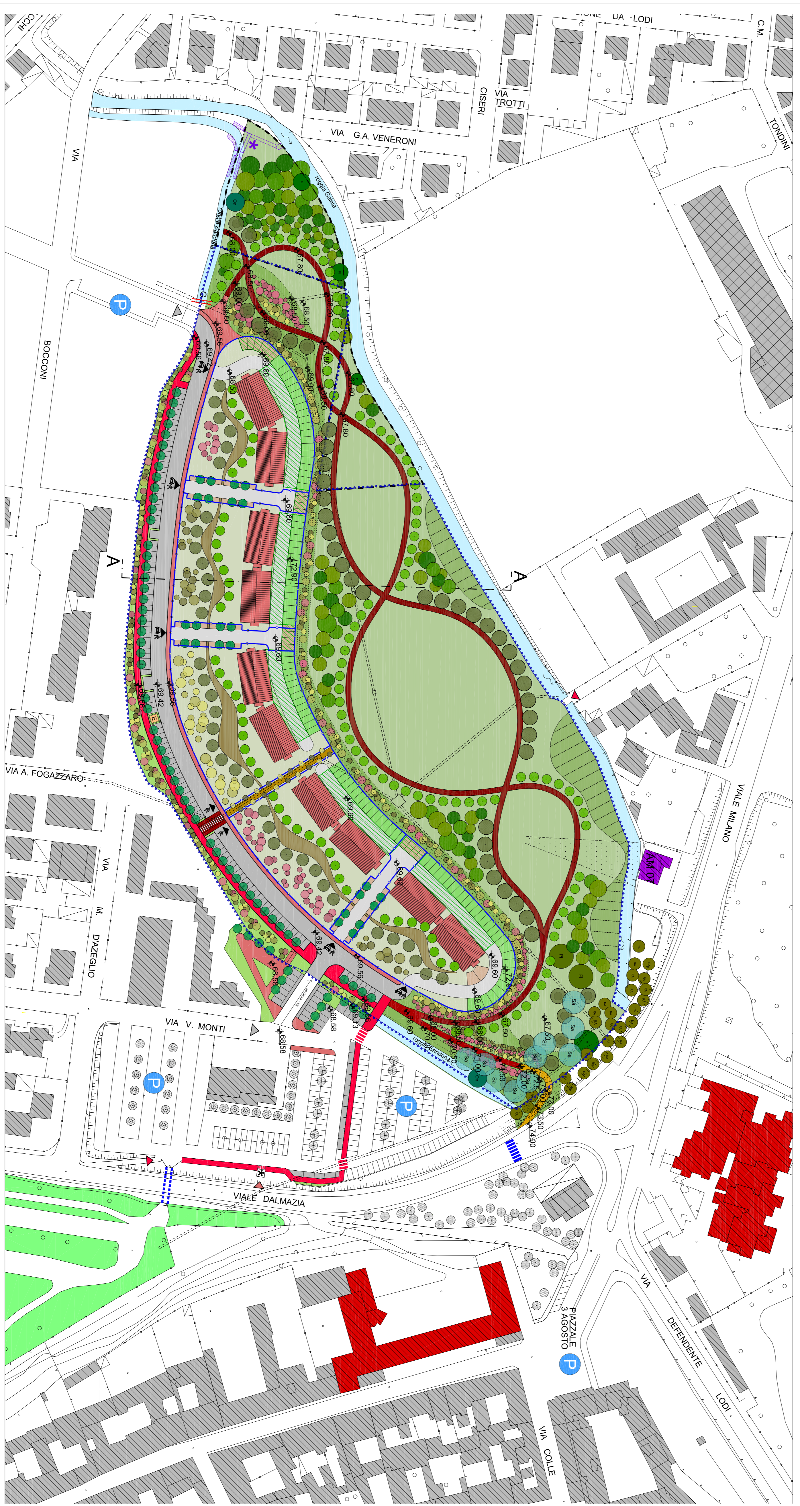
planivolumetrico - scala 1:1000