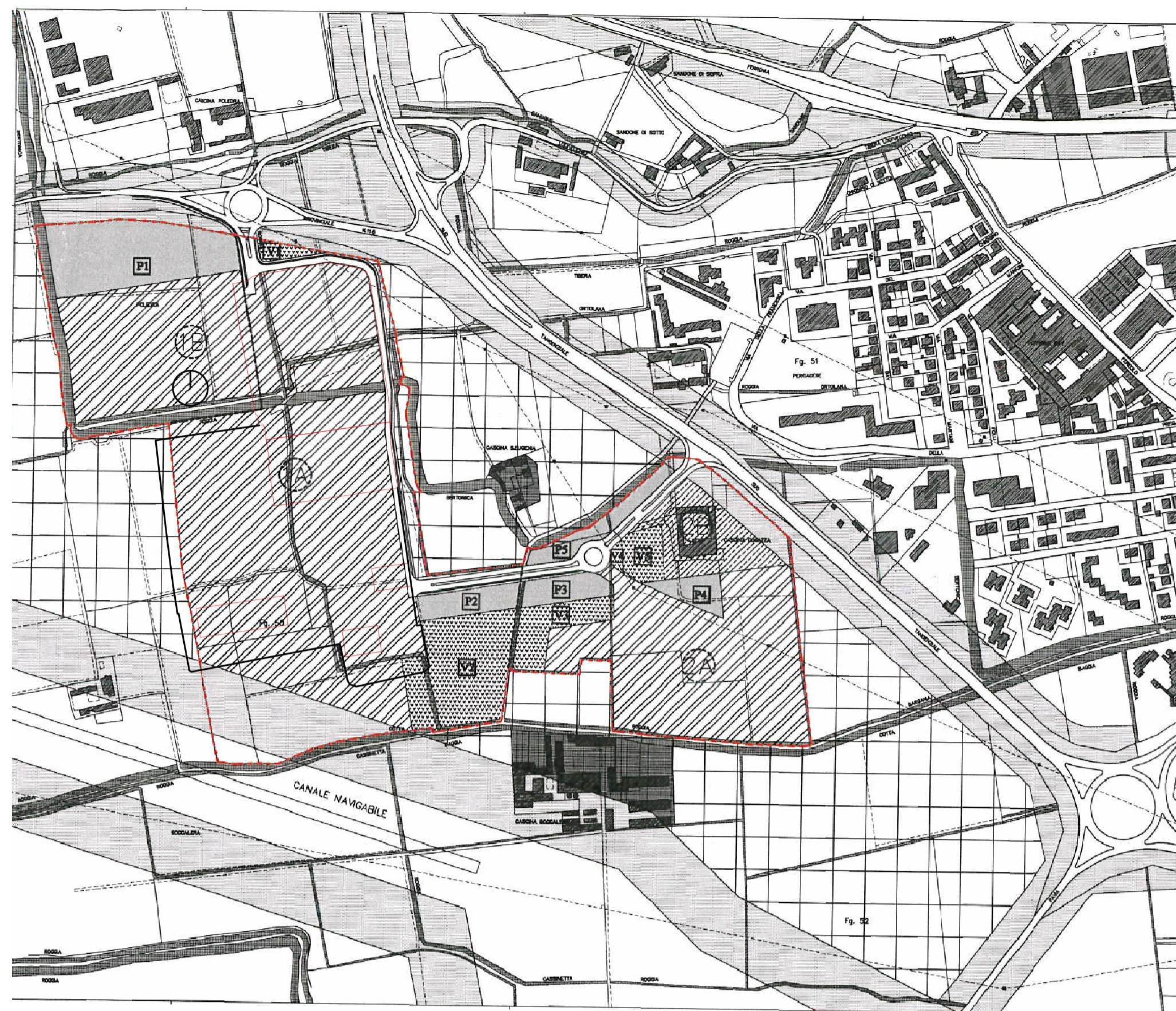
Variante al P.R.G. del Polo Univeritario 1:5.000