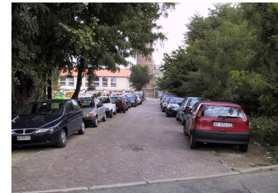
vialetto Liceo Artistico