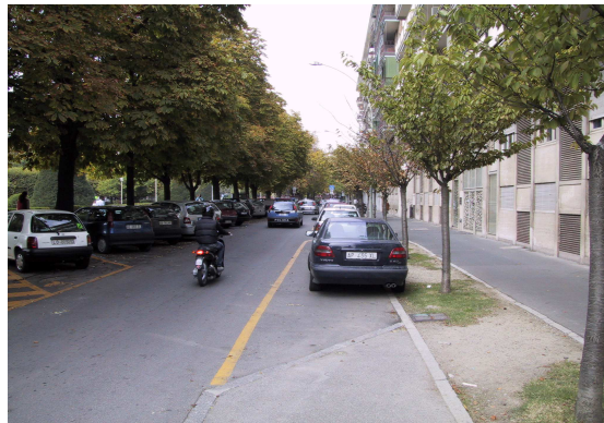
via IV novembre