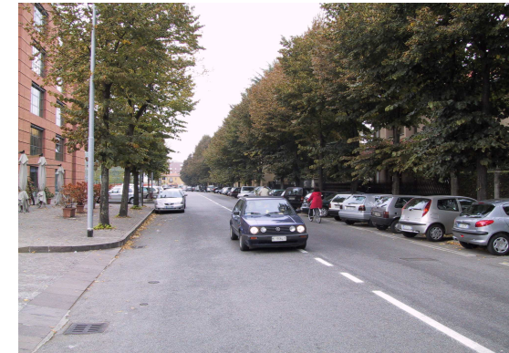
via San Bassiano