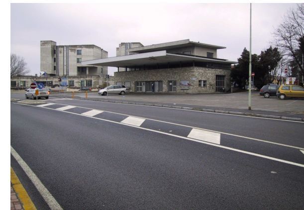
Parcheggio Tribunale (ex distributore)