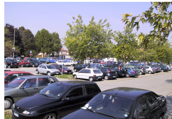
Parceggio attrezzato Ospedale