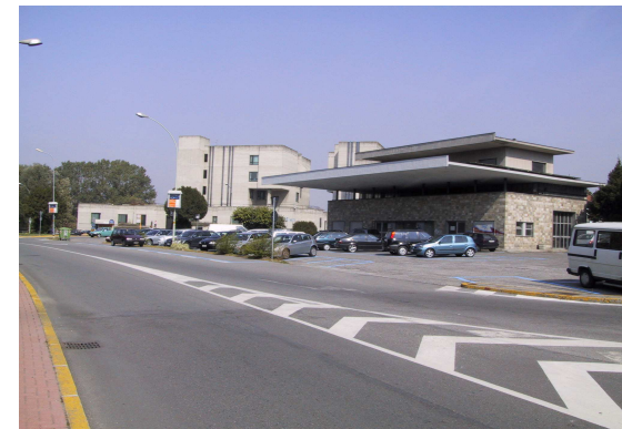
Parcheggio Tribunale (ex distributore)