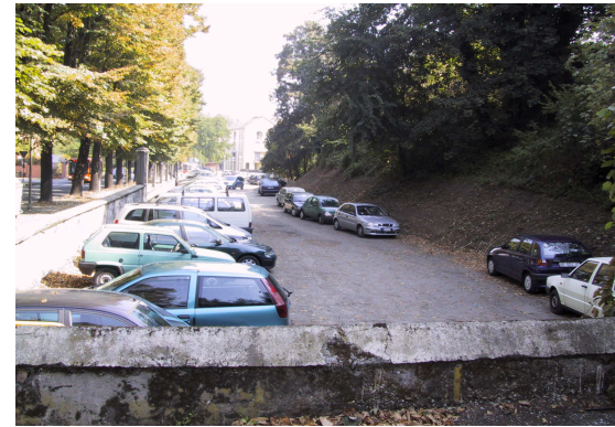
Parcheggio via Defendente