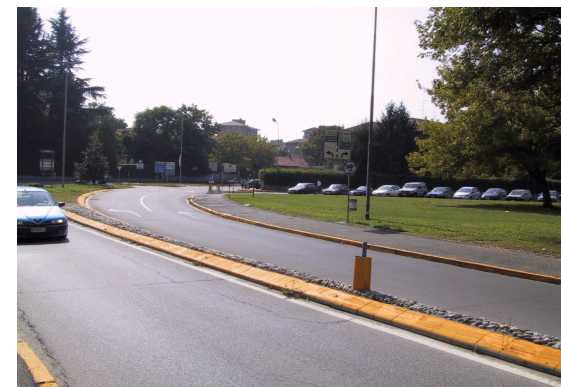
Largo Marinai d'Italia