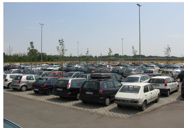
Parceggio Ospedale sosta libera