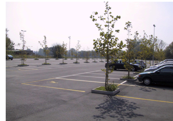
Parceggio di via Massena