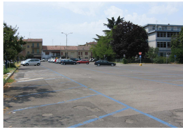
Parceggio Ospedale sosta a pagamento