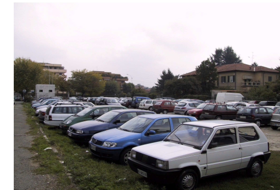
Parceggio via Lombardo