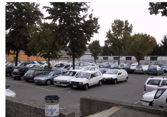
Parceggio via Villani