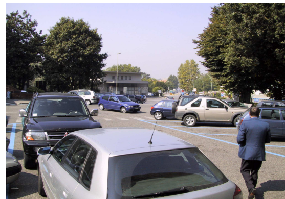
Piazzale 3 Agosto