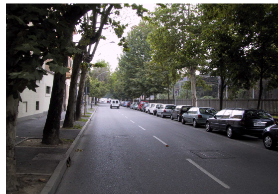
via Trento Trieste