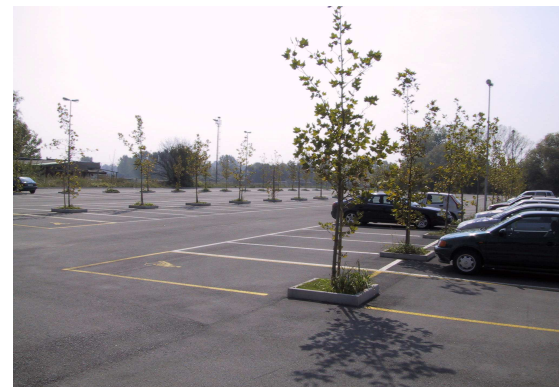
Parceggio di via Massena