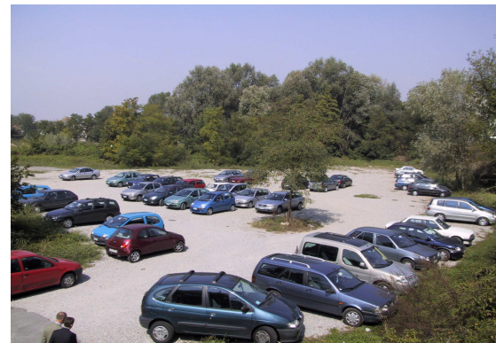
Parcheggio sterrato di via Dalmazia