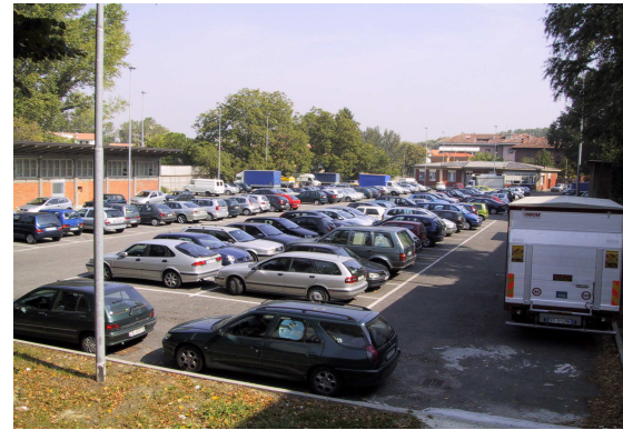
Parcheggio ex macello