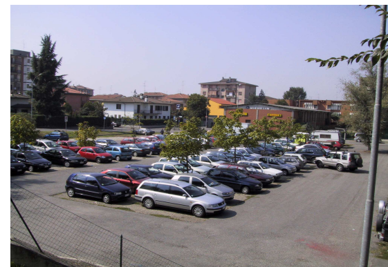
Parcheggio attrezzato di via D'Azeglio-Dalmazia