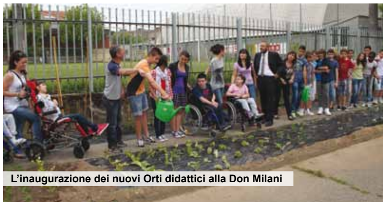
L'inaugurazione dei nuovi Orti didattici alla Don Milani