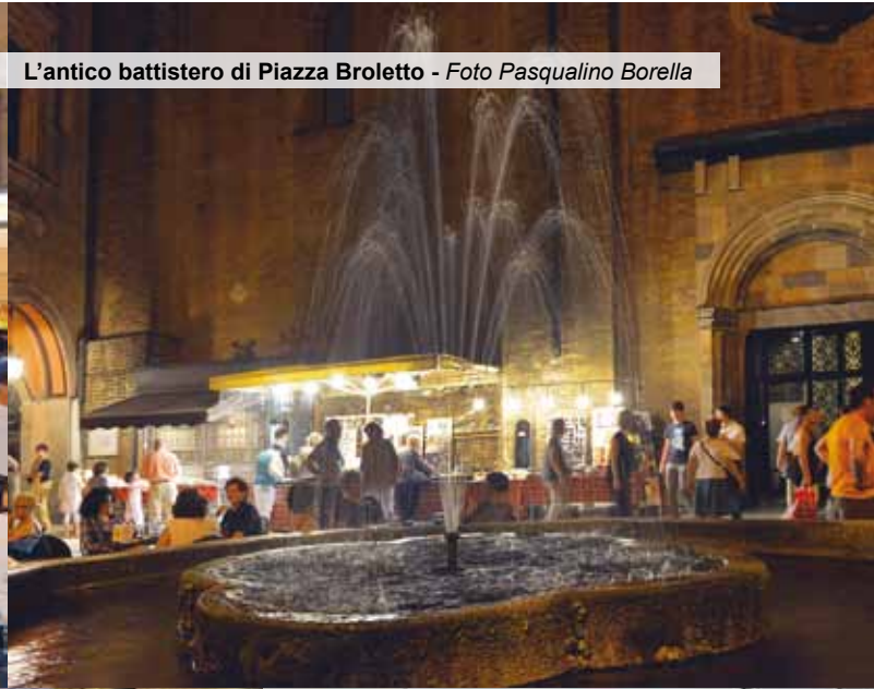
L'antico battistero di Piazza Broletto