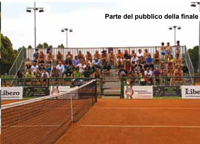
Parte del pubblico della finale