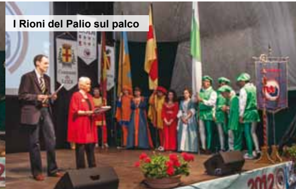
I Rioni del Palio sul palco