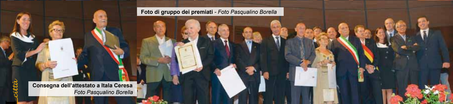
Foto di gruppo dei premiati