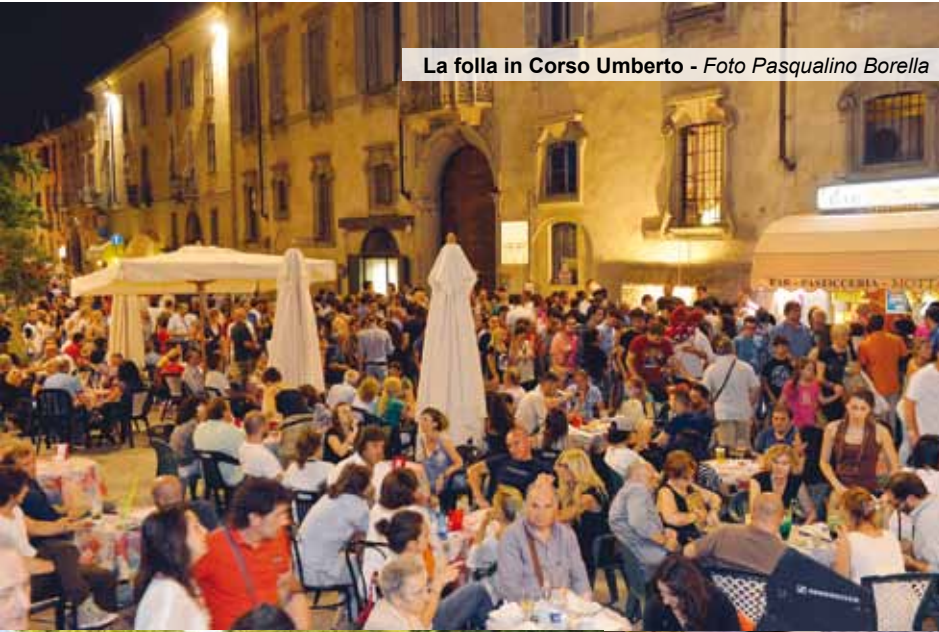
La folla in Corso Umberto