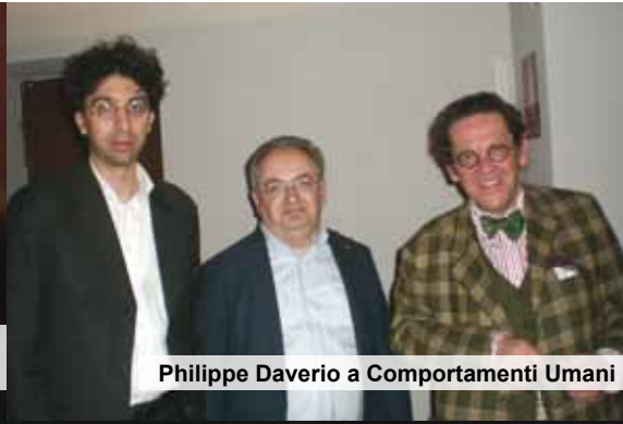
Philippe Daverio a Comportamenti Umani