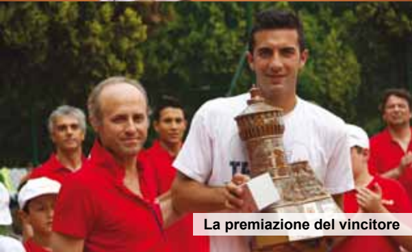
La premiazione del vincitore