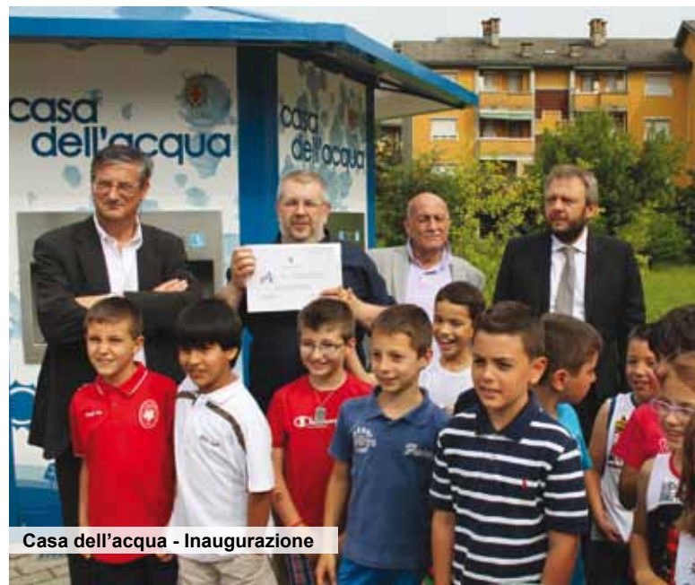
Casa dell'acqua - Inaugurazione