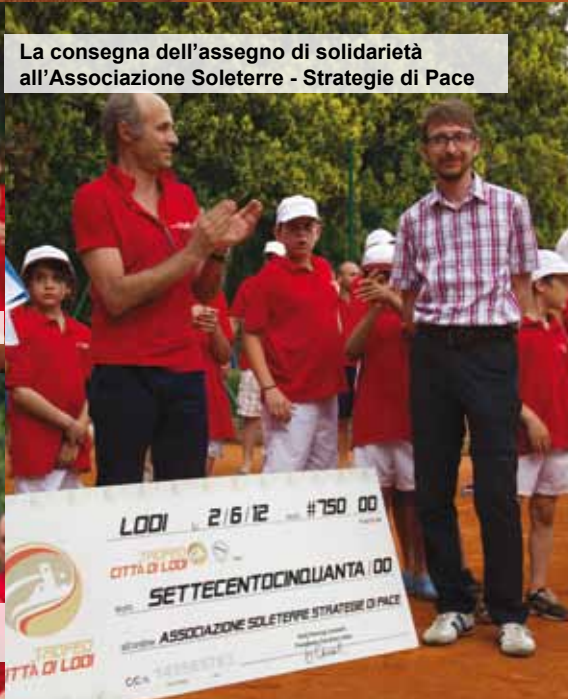
La consegna dell'assegno di solidarietà all'Associazione Soleterre - Strategie di Pace