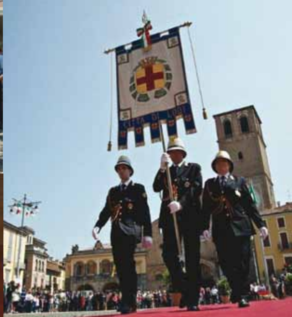
Celebrazioni del 2 giugno 2012