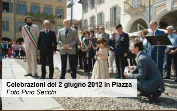
Celebrazioni del 2 giugno 2012 in Piazza