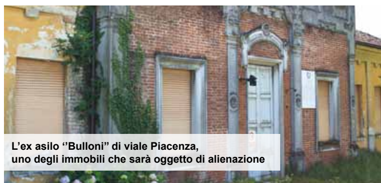
L'ex asilo "Bulloni" di viale Piacenza, uno degli immobili che sarà oggetto di alienazione

Una piccola nota positiva, infine: il Comune di Lodi ha ricevuto dal Ministero della Finanze un "premio", sotto forma di "sconto" di 90.000 euro sugli obiettivi di saldo di cassa del Patto di Stabilità, per la partecipazione (insieme ad altri 52 Comuni, 12 province e 5 Regioni) alla sperimentazione dei nuovi principi contabili degli enti locali che entreranno definitivamente in vigore nel 2014, affiancando alla contabilità di competenza quella di criterio economico-finanziario.