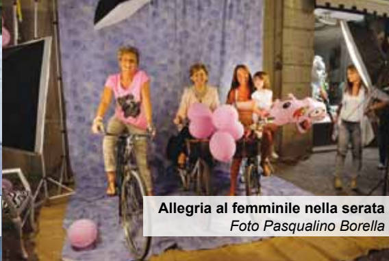
Allegria al femminile nella serata