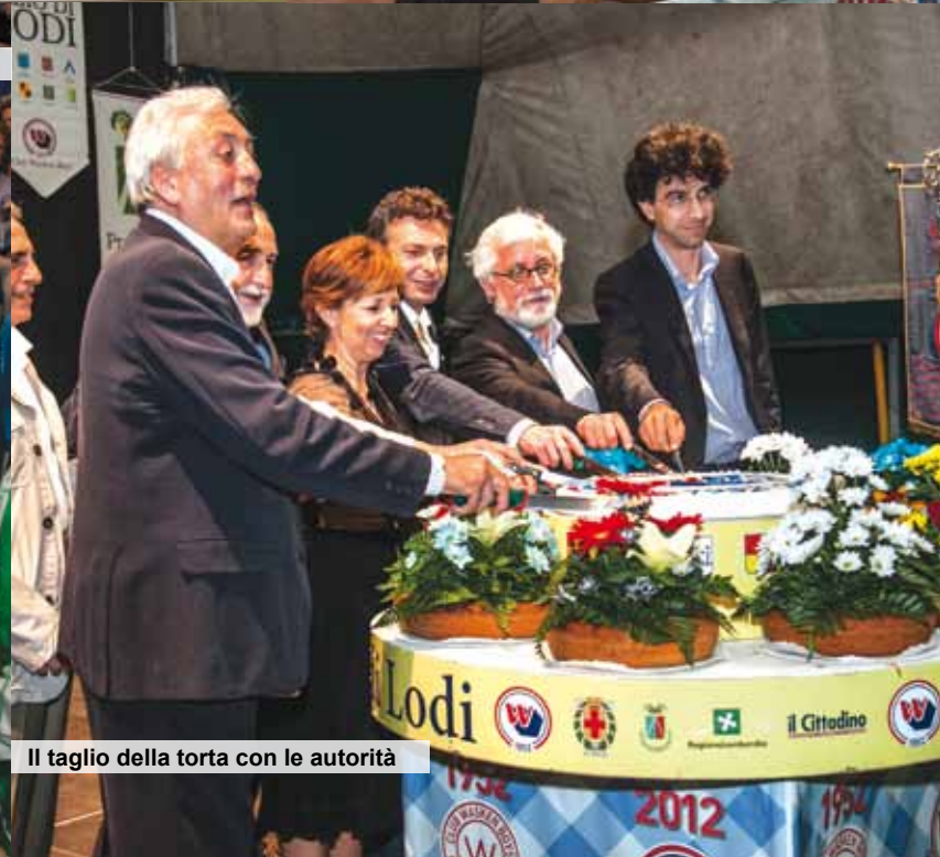
Il taglio della torta con le autorità