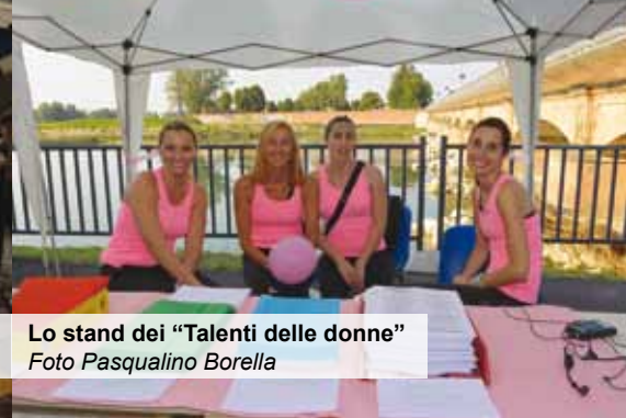
Lo stand dei "Talenti delle donne"