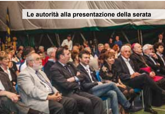
Le autorità alla presentazione della serata