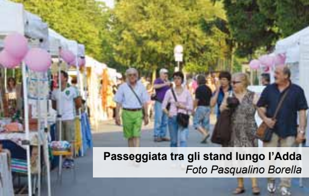
Passeggiata tra gli stand lungo l'Adda