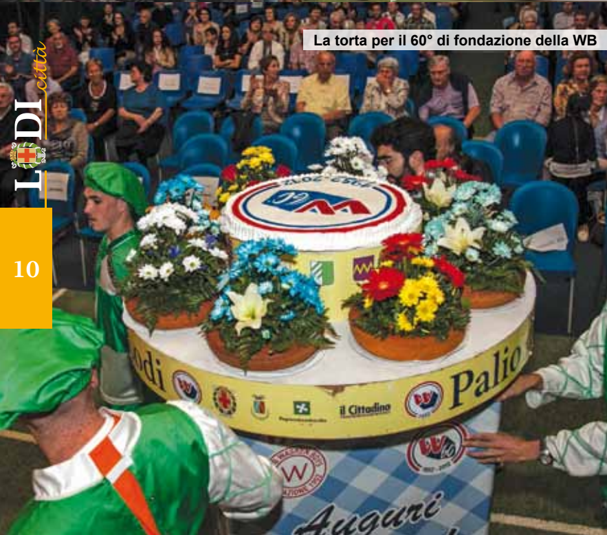
La torta per il 60° di fondazione della WB