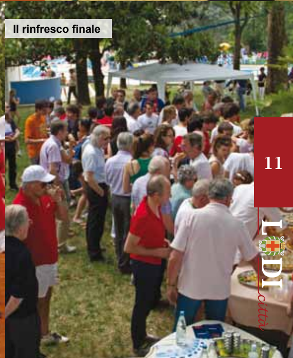
Il rinfresco finale