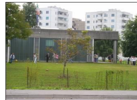
Foto edifici e/o posizione punti di misura