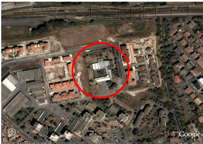
Fotografia aerea dell'area