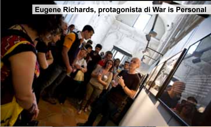
Eugene Richards, protagonista di War is Personal

da un'idea del Gruppo Fotografico "Progetto Immagine" di Lodi e rappresenta un'iniziativa unica nel suo genere: non esistono, né in ambito nazionale né internazionale, festival fotografici dedicati all'approfondimento della relazione tra etica, comunicazione e fotografia.