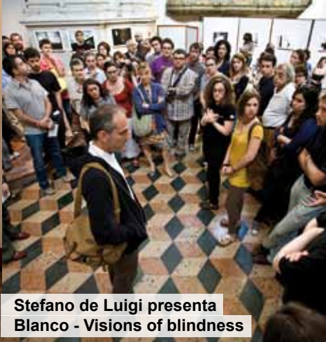
Stefano de Luigi presenta Bianco - Visions of blindness