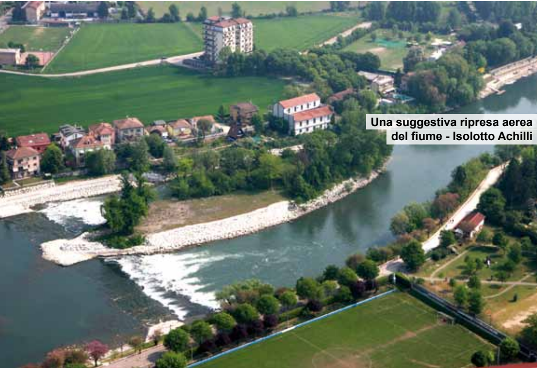
Una suggestiva ripresa aerea del fiume - Isolotto Achilli