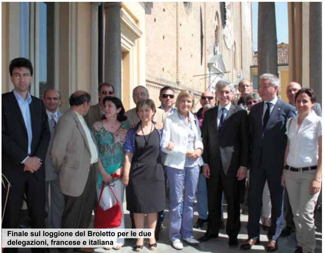
Finale sul loggione del Broletto per le due delegazioni, francese e italiana