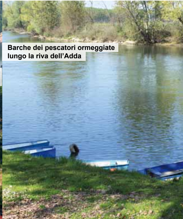
Barche dei pescatori ormeggiate lungo la riva dell'Adda