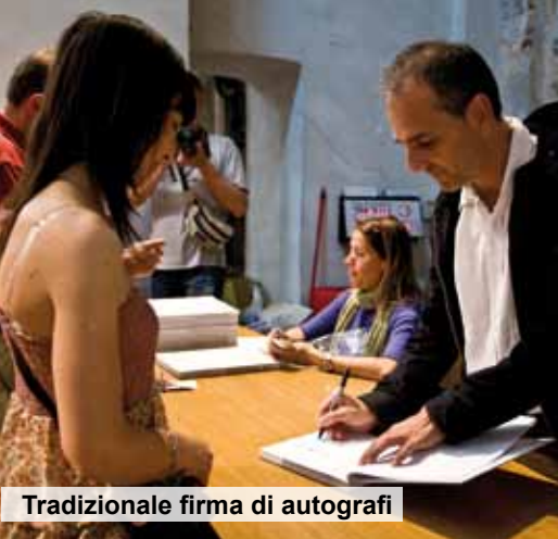
Tradizionale firma di autografi