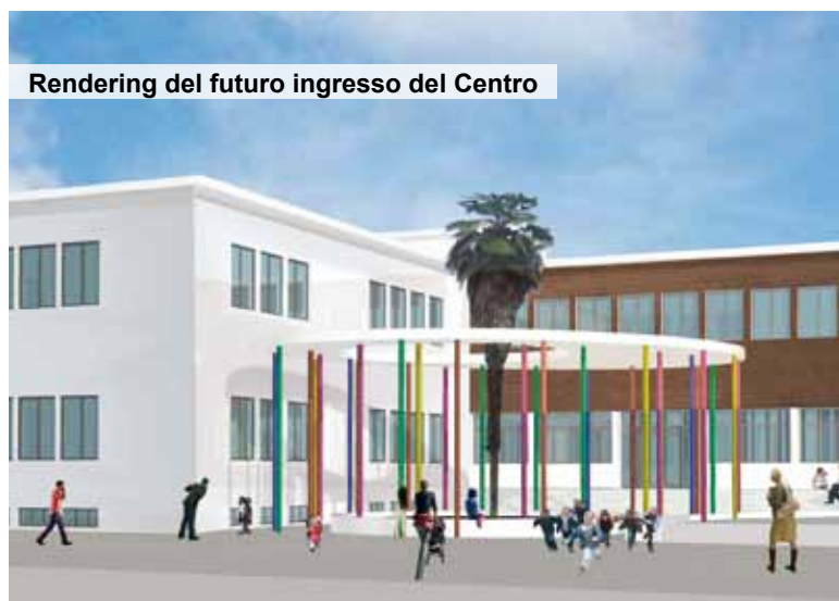
Rendering del futuro ingresso del Centro

L'idea progettuale dello studio modenese ha inteso conservare e valorizzare l'edificio razionalista dei primi anni '30, procedendo secondo criteri di restauro del moderno e delegando a sistemi ambientali, a scala intermedia tra l'architettura e l'arredo, il compito di organizzare le funzioni del Centro e gestire l'immagine di bambino che deve essere rappresentata. Va da sé, infatti, che l'ambiente, cioè l'insieme di qualità spaziali e sensoriali (architettura, arredi, qualità immateriali dello spazio come colore, luce, materiali) risulti determinante in un progetto pedagogico. La sfida, secondo il Sindaco Lorenzo Guerini, non è quella di creare un involucro vuoto da riempire di informazioni e regole, per quanto buone, bensì un luogo adatto per il vero soggetto protagonista: il