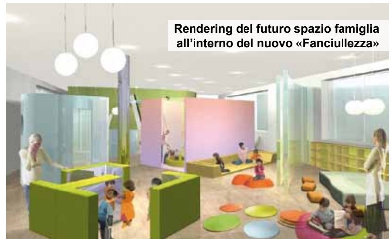
Rendering del futuro spazio famiglia all'interno del nuovo «Fanciullezza»

Nel Centro storico della città verrà così inserita una nuova e moderna scuola dell'infanzia, con un ampio spazio verde ed accessi in totale sicurezza.