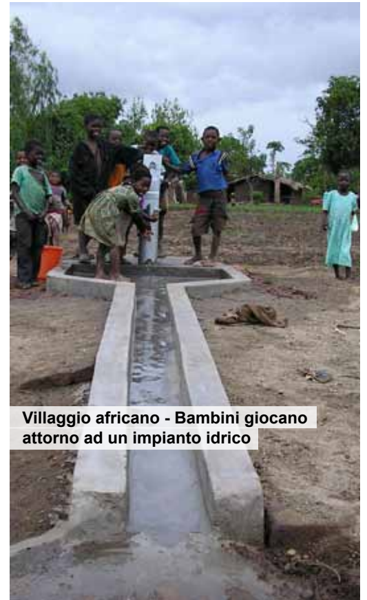
Villaggio africano - Bambini giocano attorno ad un impianto idrico

km. di impianto ed una copertura di 100 km2., che hanno donato agli abitanti dei villaggi la possibilità di usufruire di circa 90 fontane e rifornirsi d'acqua senza dover affrontare viaggi lunghi. Per tutti i progetti, realizzati anche grazie ai finanziamenti del Ministero degli Esteri e dell'Unione Europea, risulta fondamentale la partecipazione delle comunità locali, coinvolte in un lavoro di formazione ed assistenza, per abituare le popolazioni a costruire poco alla volta da se stesse il proprio modello di sviluppo. Il radicamento nella comunità lodigiana è un aspetto imprescindibile: negli anni il M.L.F.M. ha saputo creare a Lodi un rapporto di fiducia con i sostenitori locali, grazie all'efficacia e alla trasparenza del suo lavoro. Ora è impegnato in campagne di sensibilizzazione ed educazione con frequenti interventi nelle scuole (anche per gli universitari), corsi di volontariato e campi lavoro all'estero.