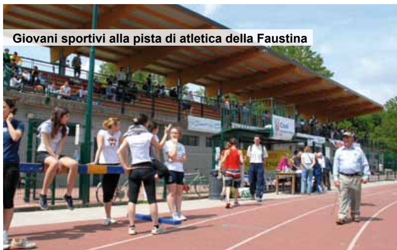
Giovani sportivi alla pista di atletica della Faustina

Dopo i controlli effettuati dalla Polizia Municipale e dalle Forze di Polizia, l'ordinanza sindacale pone un argine a situazioni che, oltre ad offrire spettacoli diseducativi nei confronti dei molti minori che frequentano la Faustina, aggravano la percezione di disagio e insicurezza. Le violazioni sono punite con l'applicazione della sanzione pecuniaria compresa tra un minimo di 75 ad un massimo di 500 euro.