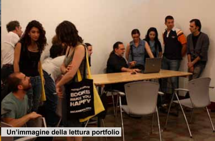
Un'immagine della lettura portfolio