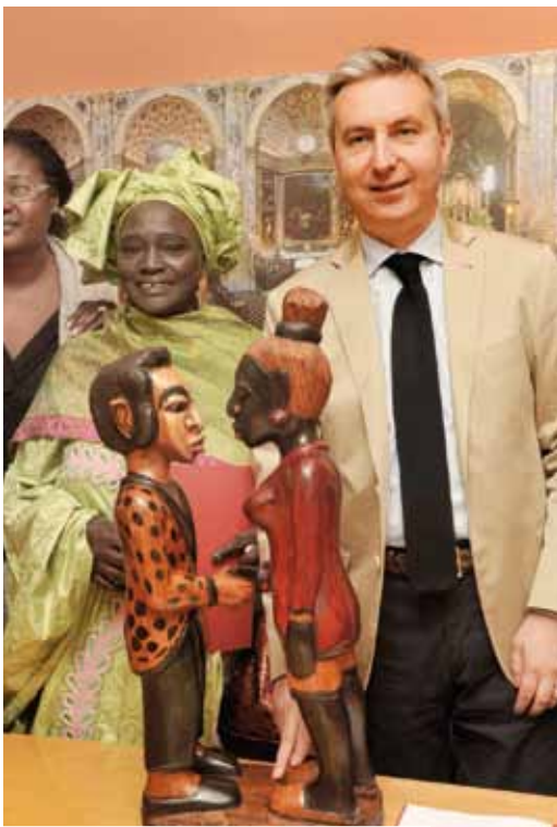
Il Sindaco di Lodi con la collega senegalese al termine dell'incontro

La visita di una delegazione istituzionale della città francese di Fontainebleau (nord della Francia, non lontana da Parigi), composta dal sindaco Frédéric Valletoux e dall'assessore alla cultura Hélène Maggiori, ha interessato il 20 e 21 maggio il nostro capoluogo. Dopo un sopralluogo alle strutture del Parco Tecnologico Padano, l'incontro in Broletto con il breve saluto in forma privata al Sindaco di Lodi, Lorenzo Guerini e, a seguire, l'incontro con una rappresentanza del Consiglio comunale hanno sancito l'avvio di un percorso che porterà alla firma di un Accordo di gemellaggio tra le due realtà cittadine. In aula consiliare i due Sindaci hanno tenuto i rispettivi discorsi, in cui oltre al tradizionale benvenuto con lo scambio dei doni (libri da parte francese, ceramiche lodigiane e prodotti culinari locali da parte italiana), si è stabilito per il prossimo mese di ottobre il successivo incontro, questa volta in Francia, per siglare il gemellaggio, favorito dalla comune amicizia con la città tedesca di Konstanz, da anni a sua volta gemellata ad entrambe.