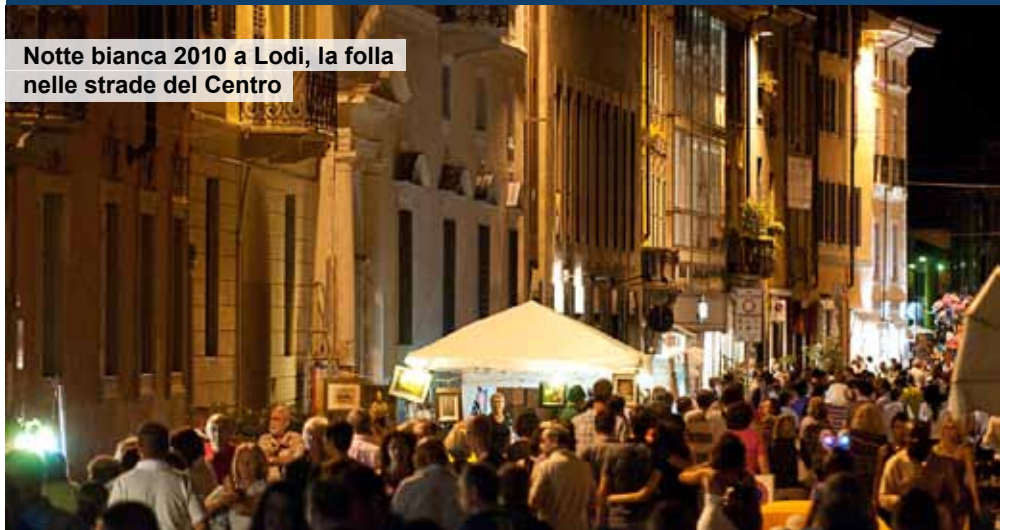
Notte bianca 2010 a Lodi, la folla nelle strade del Centro

CENTRO DI REVISIONE MAGNETI MARELLI LAUDENSE