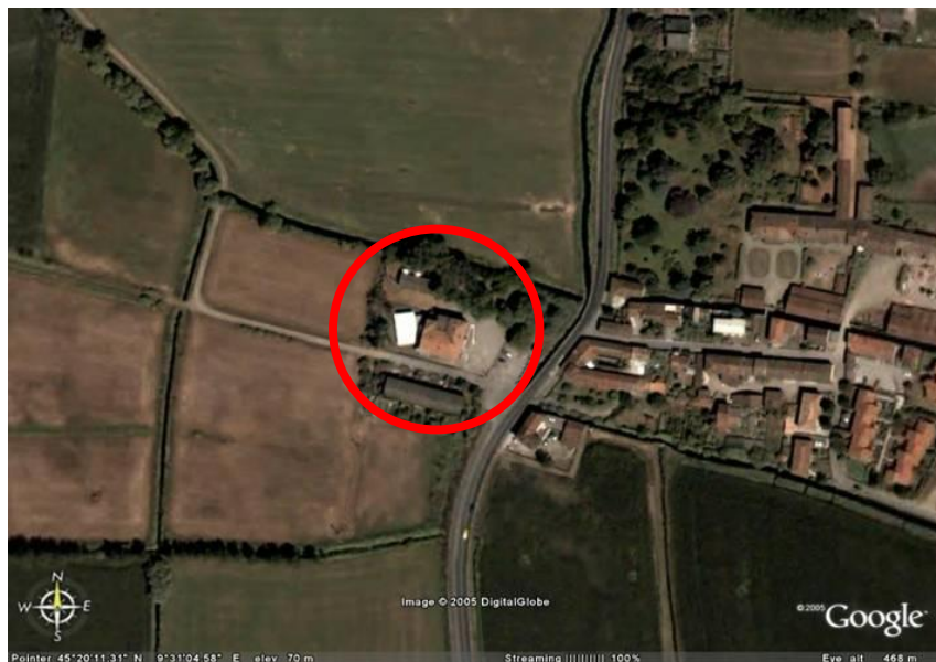
Fotografia aerea dell'area