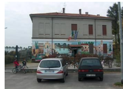
Foto edifici e/o posizione punti di misura