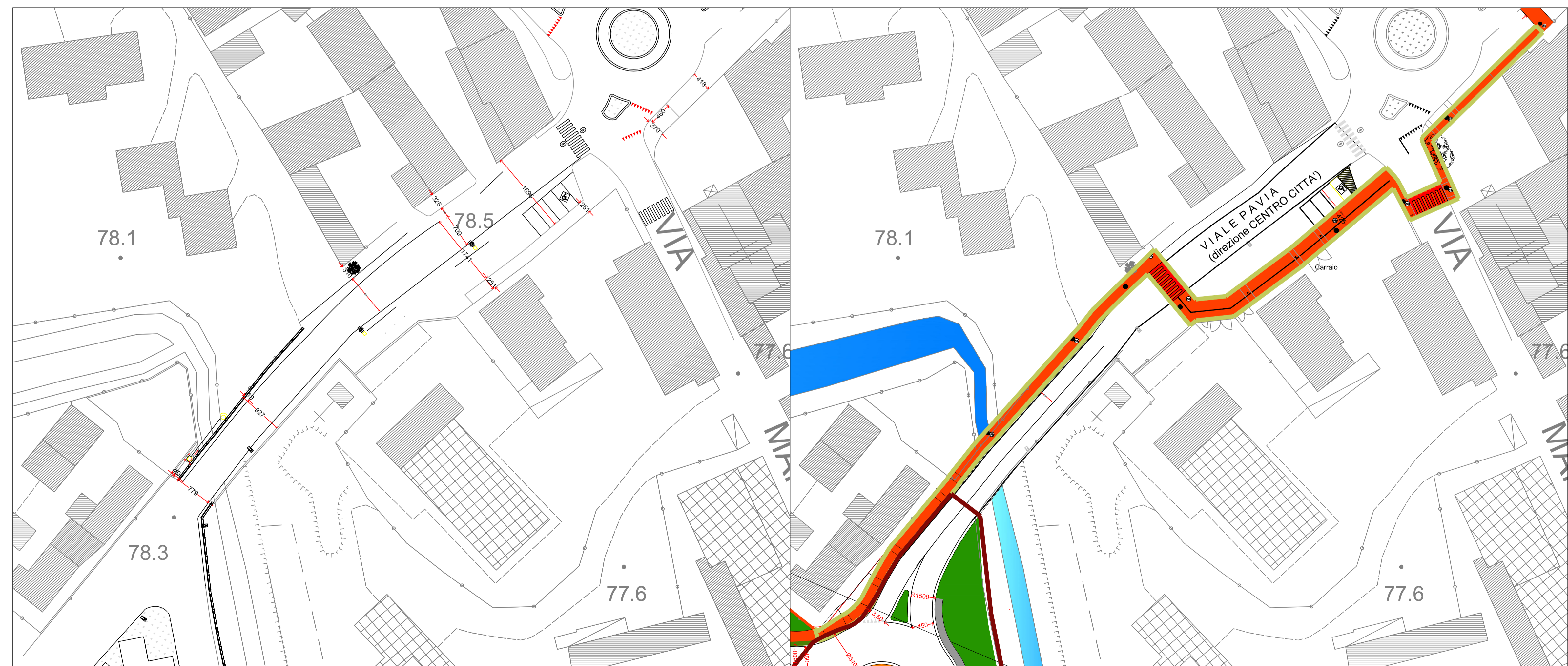
D - NUOVA PISTA CICLABILE - STATO DI FATTO