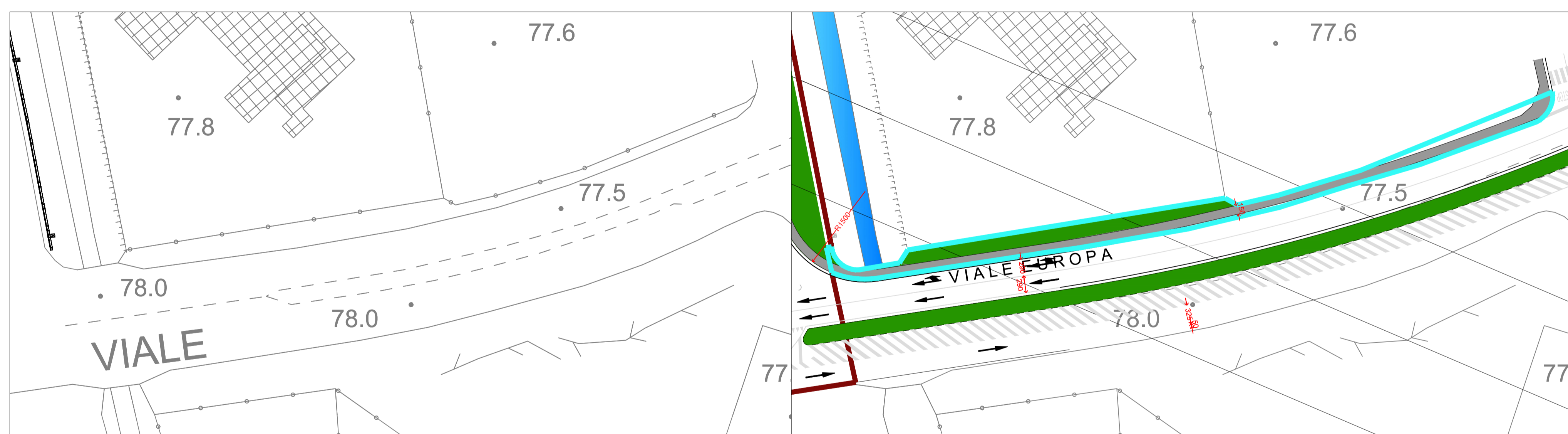
F - NUOVA MARCIAPIEDE V.LE EUROPA - STATO DI FATTO