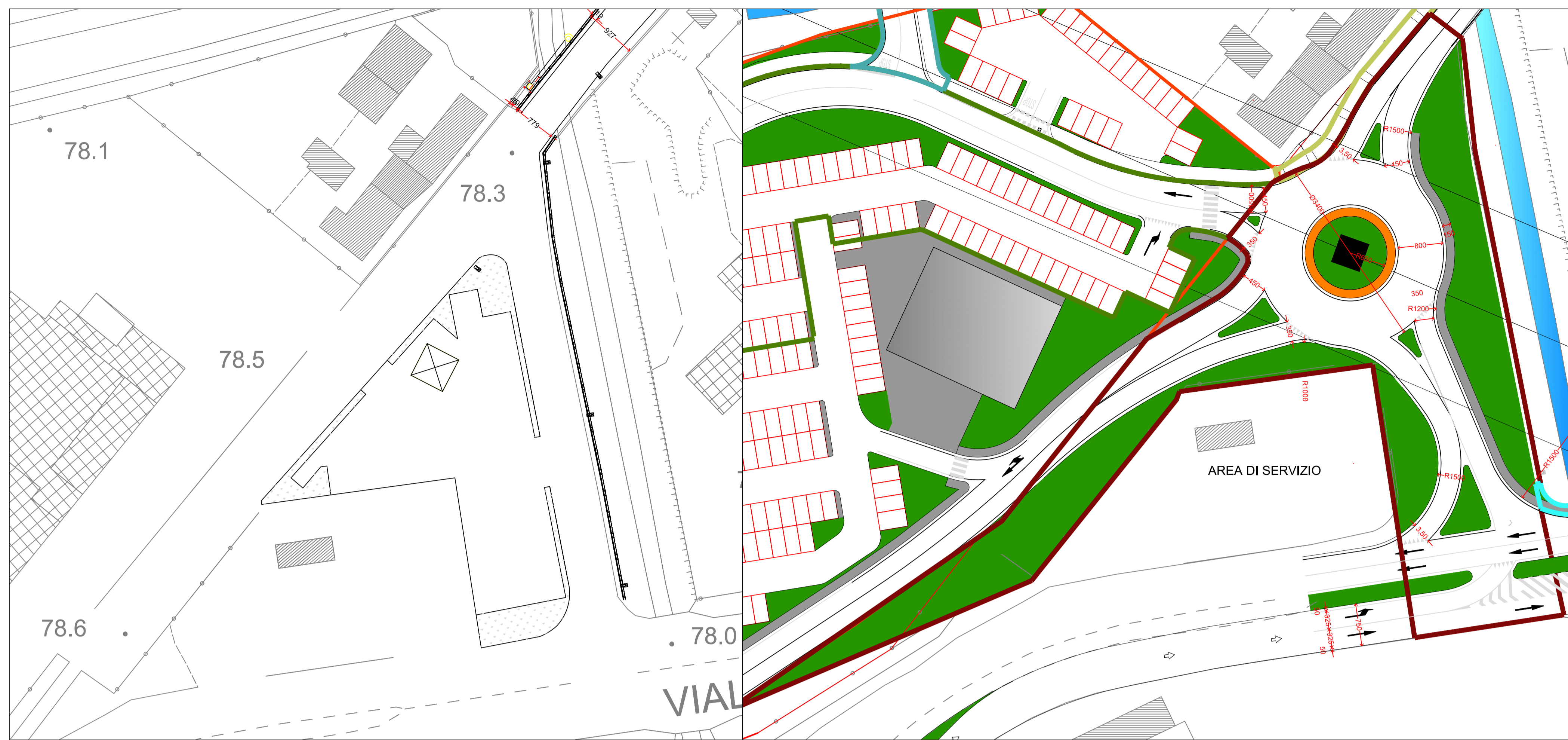
A - NUOVA INTERSEZIONE A ROTATORIA - STATO DI FATTO