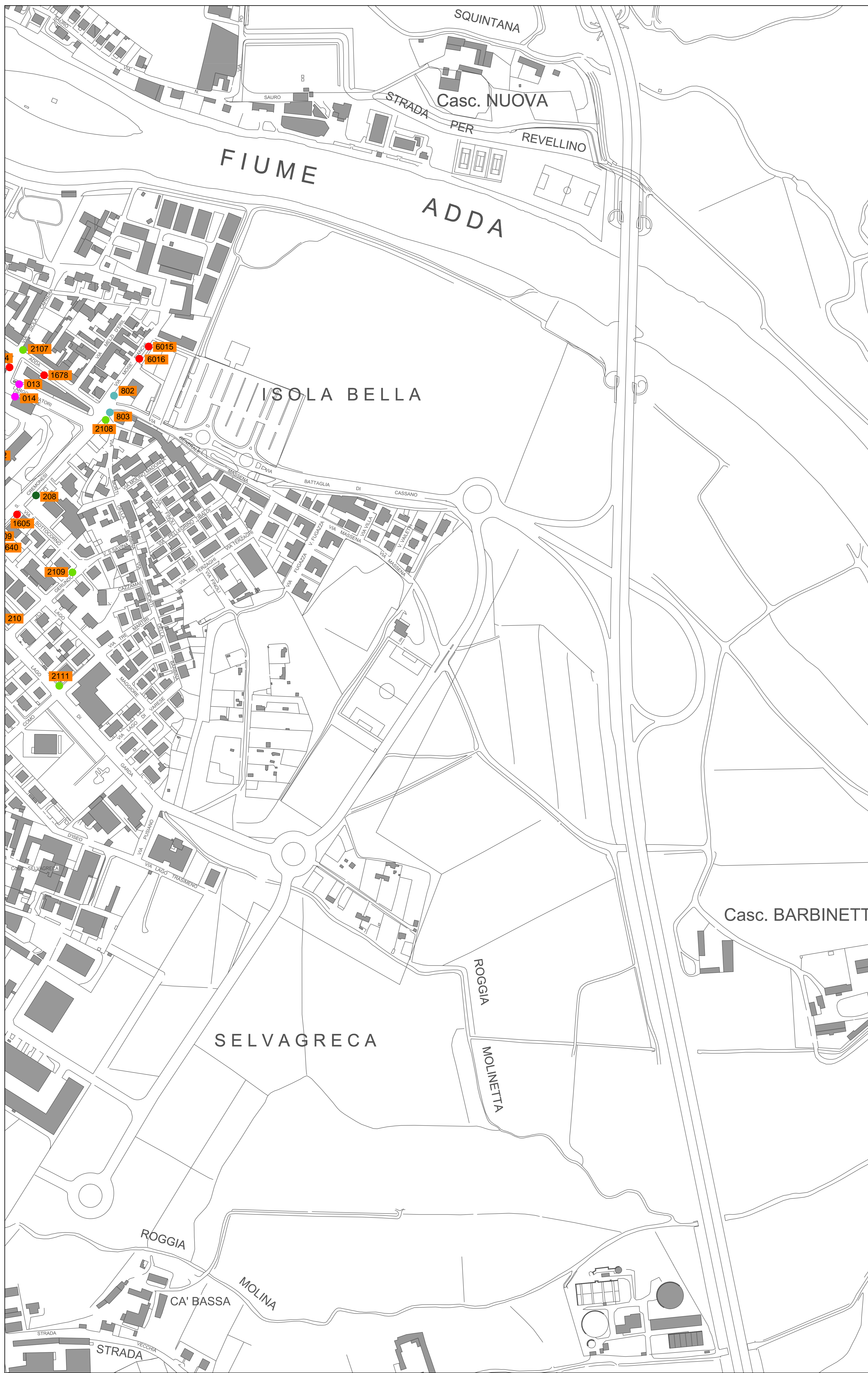
Tavola nr. 7P