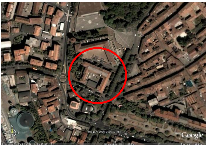
Fotografia aerea dell'area