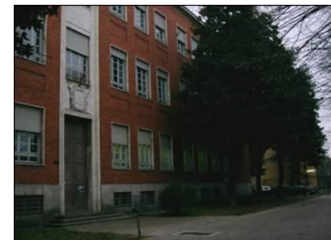
Foto edifici e/o posizione punti di misura