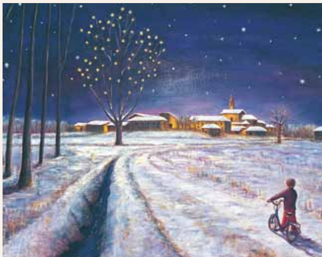
Andrea Ferrari Bordogna (Milano, 1965 - vivente), NOTTE SANTA, olio su tela, 2002, cm. 100 x 150

Un proverbio indiano parla di quattro stadi nella vita dell'uomo. Il primo è quello nel quale si impara, il secondo è quello nel quale si insegna e si servono gli altri, mettendo a punto ciò che si è imparato. Nel terzo stadio si va nel bosco, e questo è molto profondo, significa che il terzo stadio è quello del silenzio, della riflessione, del ripensamento. Credo che quando si aprirà per me questo terzo stadio, che è ormai imminente, ritirandomi nel bosco potrò ripensare e riordinare con gratitudine tutte le cose che ho ricevuto, le persone che ho incontrato, gli stimoli che mi sono stati dati in questi ventidue anni e che non hanno avuto l'opportunità di essere elaborati. E poi c'è il quarto tempo, che è molto significativo per la mistica e l'ascesi indu: si impara a mendicare; è il tempo in cui si impara la mendicizia. L'andare a mendicare è il sommo della vita ascetica. È poi lo stadio del dipendere da altri, quello che non vorremmo mai, ma che viene, al quale dobbiamo prepararci.