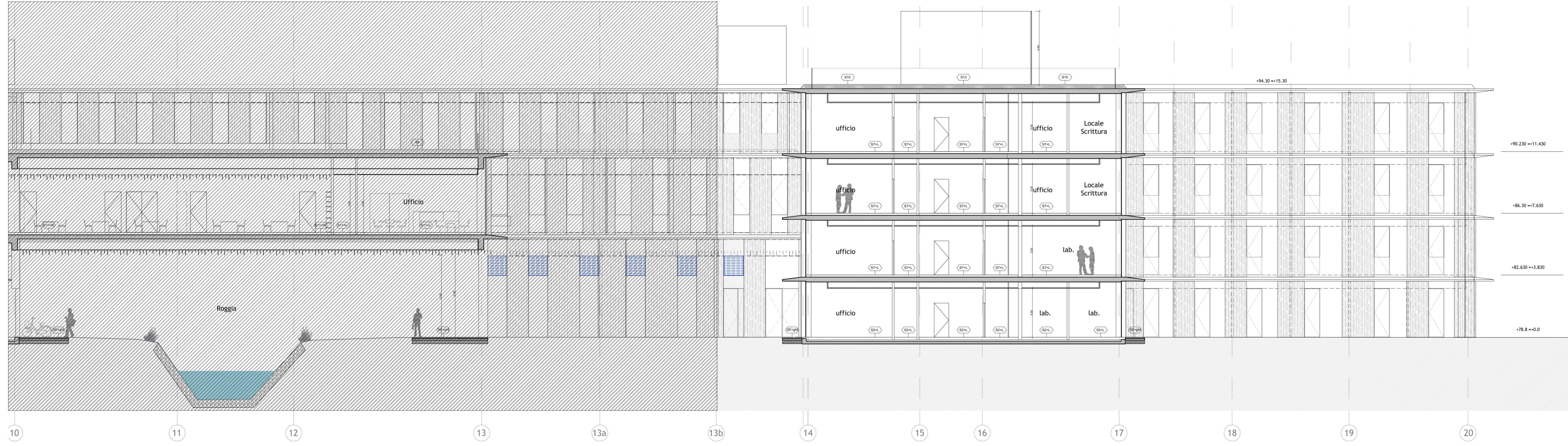
Sezione longitudinale 2