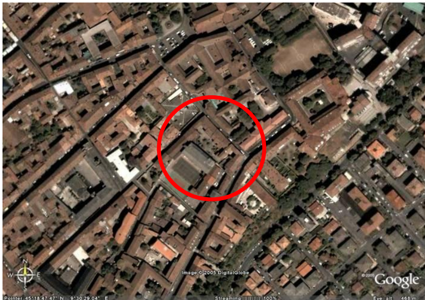
Fotografia aerea dell'area