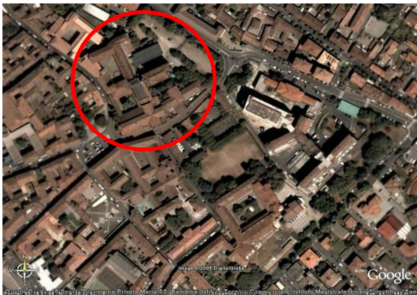
Fotografia aerea dell'area