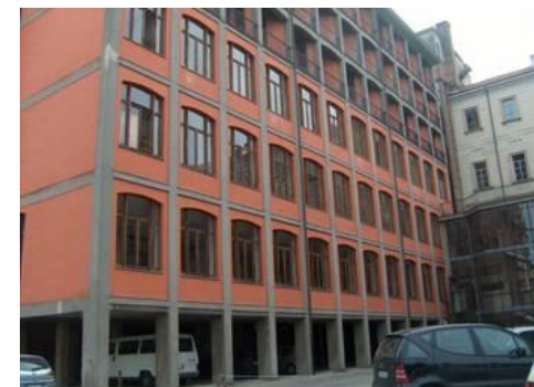
Foto edifici e/o posizione punti di misura