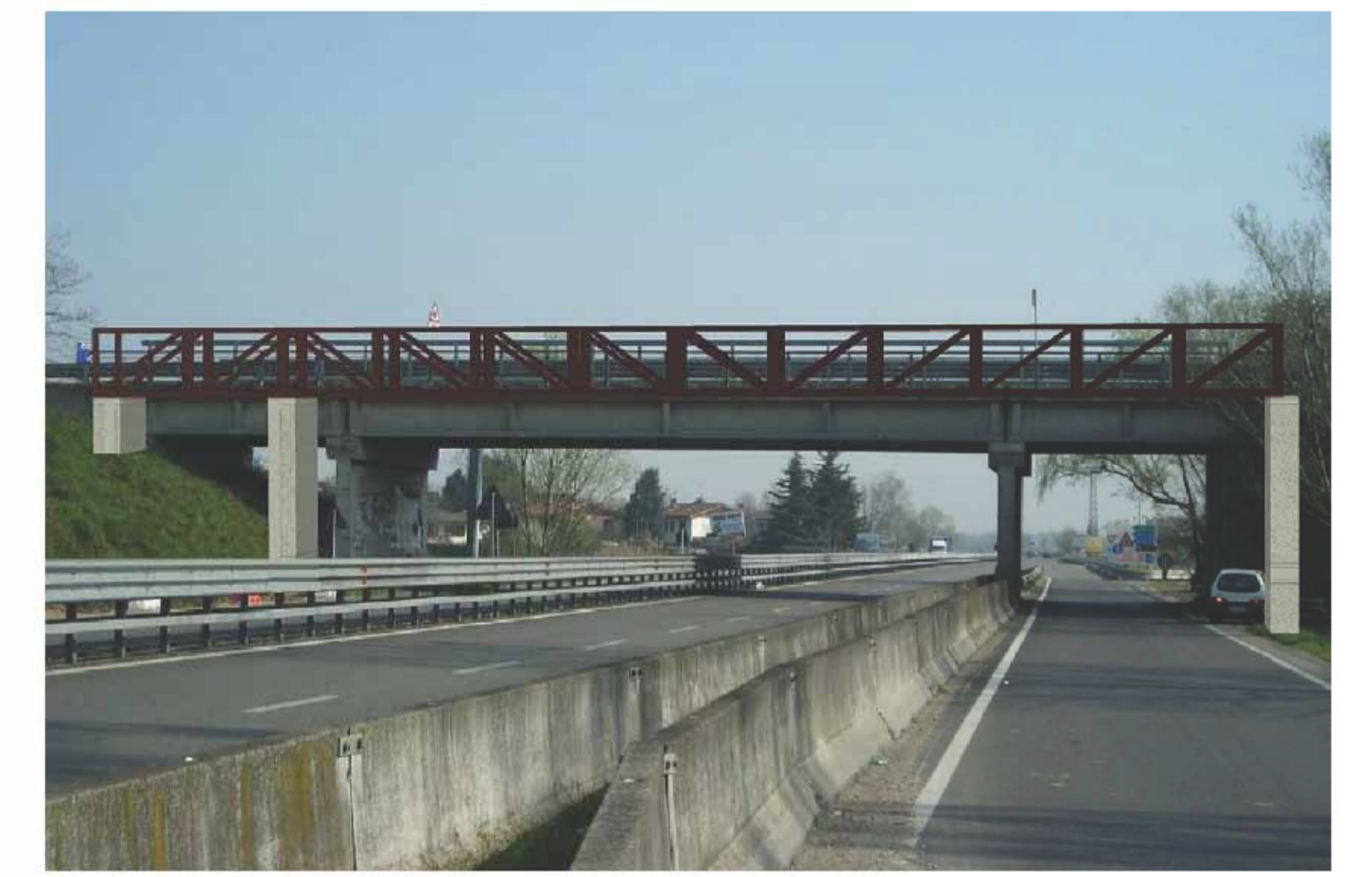
PASSERELLA CICLOPEDONALE IN FERRO - ASSONOMETRIA