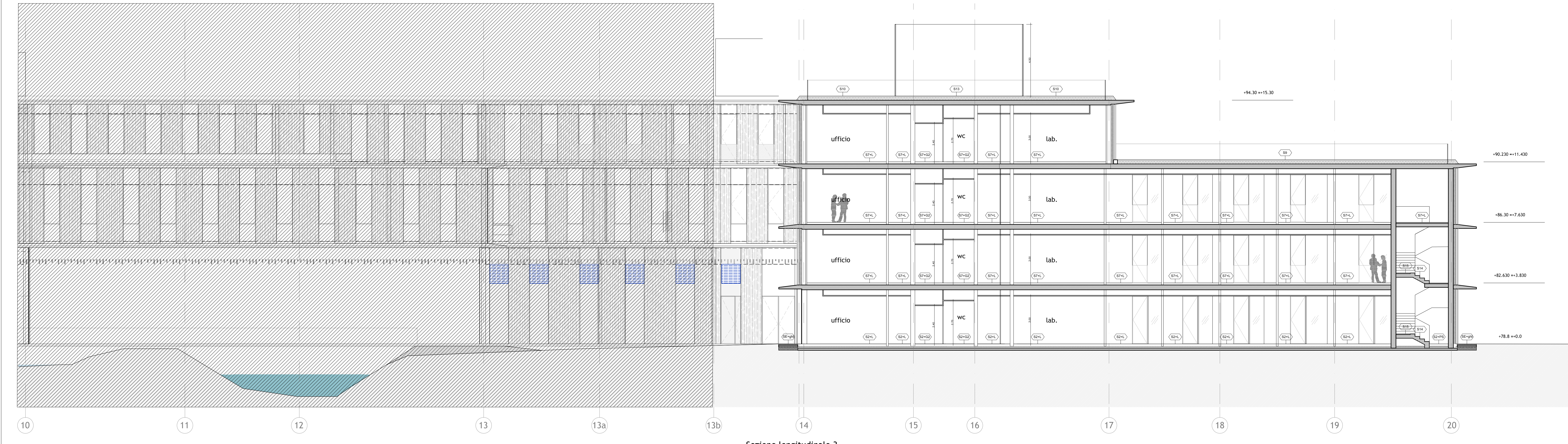
Sezione longitudinale 3