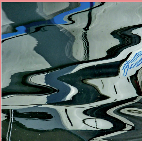
Linee Fluttuanti Fotografia digitale 50x50