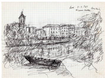
L'Adda a Lodi, 1985 matita e pennarello su carta quadrettata, cm 21x28