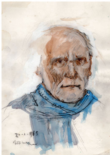
L'artista con la sciarpa blu , 1985 matita e acquerello su carta, cm 35x24,5