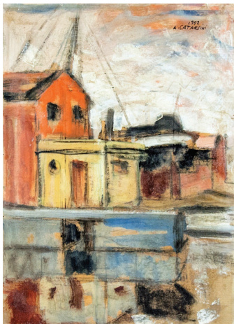
Vecchio cantiere, 1952 olio su cartone, cm 34x24

che non ha mai conosciuto cedimenti, interpretando i mutamenti di linguaggio del '900, anche attraverso le sollecitazioni che gli venivano dal vivace clima culturale versiliese.