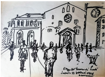
Piazza del Duomo di Lodi, 1991 matita e pennarello su carta, cm 24x33