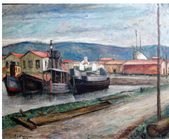
Barche nel porto di Viareggio, 1939 olio su tavola, cm 56x70