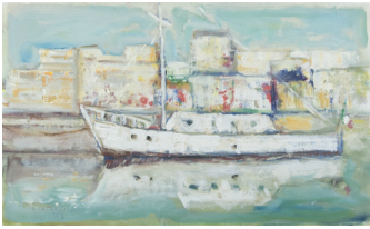
Barca nel canale , 1956 olio su cartone, cm 28,5x56

te la lotta partigiana in Lucchesia, rieditato nel 2021 da La Nave di Teseo.