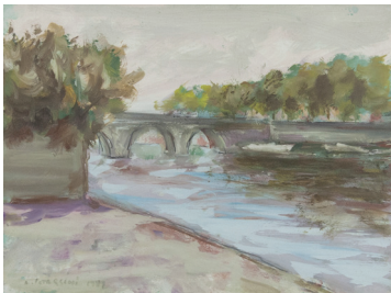
Ponte sul fiume, 1982 olio su compensato, cm 30x40