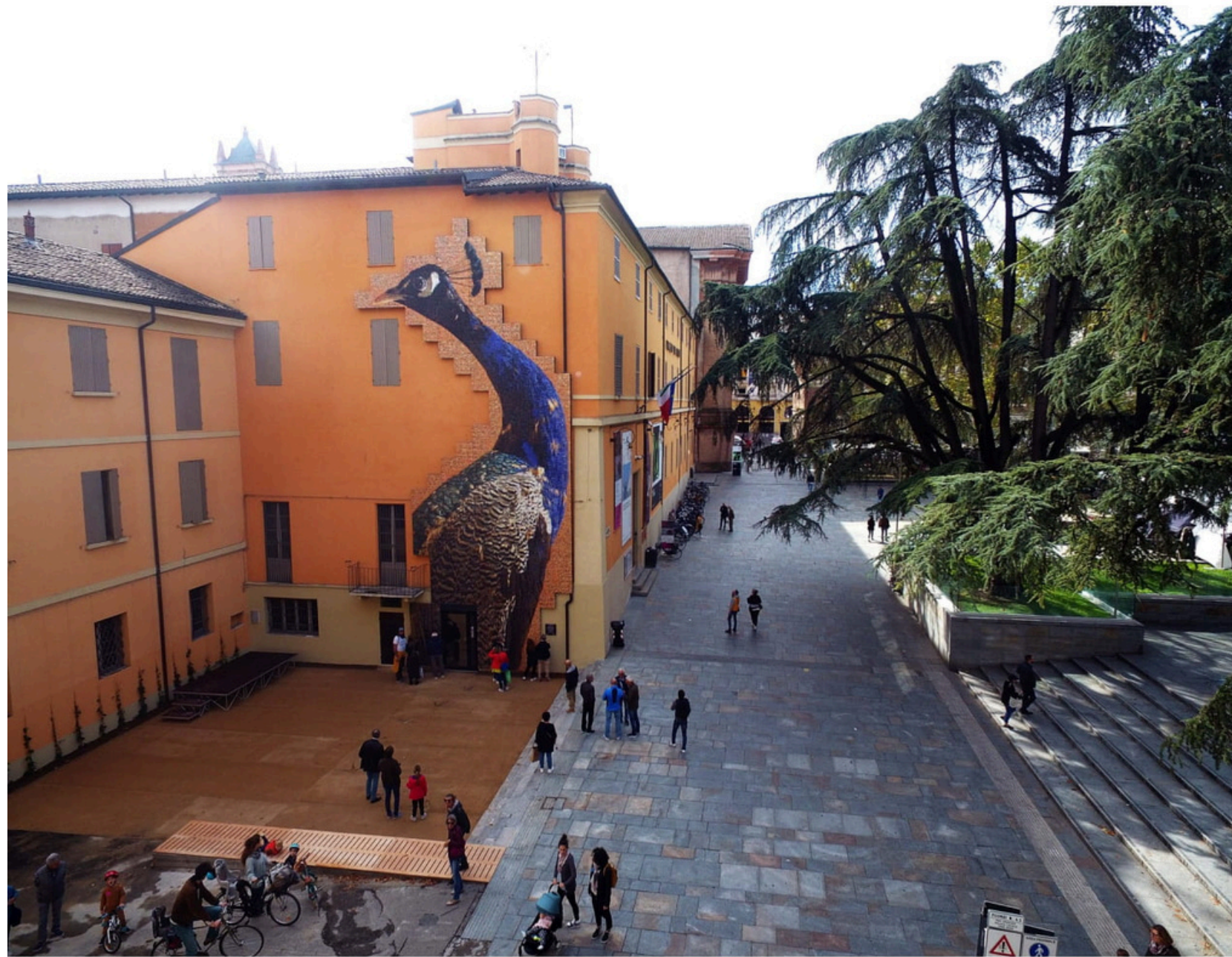
CURIOSA MERAVIGLIOSA / JOAN FONTCOUBERTA CON LA COLLABORAZIONE DELL'INTERA CITTÀ