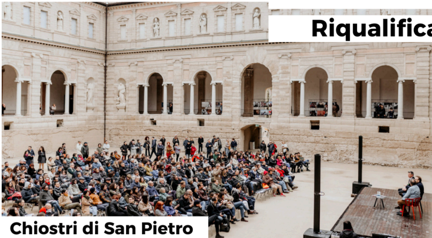
Chiostrini di San Pietro