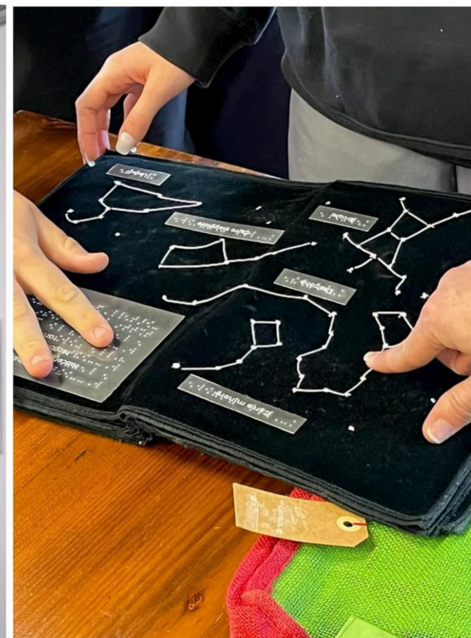
L'ARTE DI TOCCARE L'ARTE. BELLO E ACCESSIBILE / IN COLLABORAZIONE CON ISTITUTO GARIBALDI