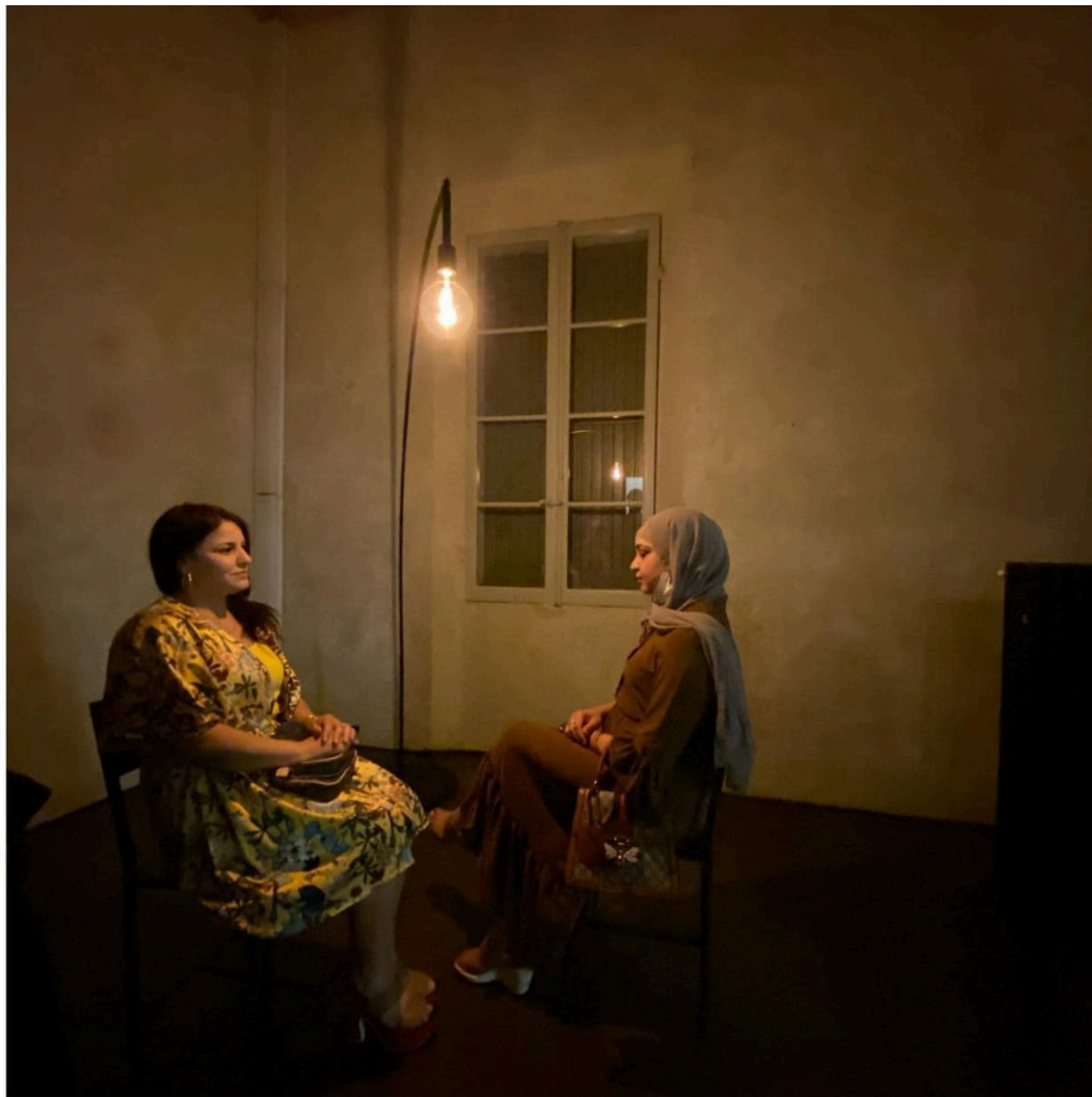
PROGETTO DRIS / DI COSA HAI PAURA? CON-TATTO DI PAROLE, IMMAGINI, SUONI