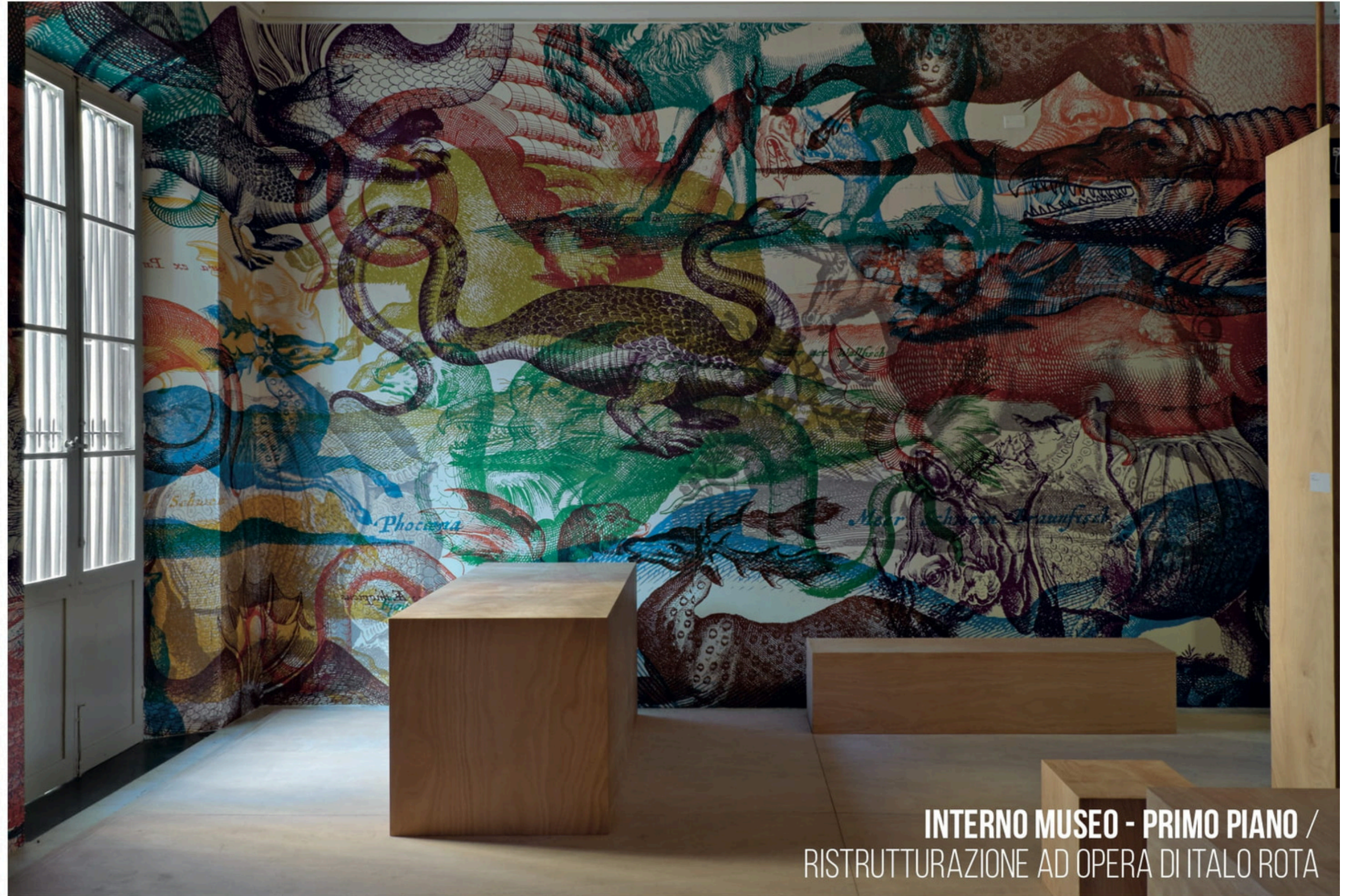
INTERNO MUSEO - PRIMO PIANO / RISTRUTTURAZIONE AD OPERA DI ITALO ROTA