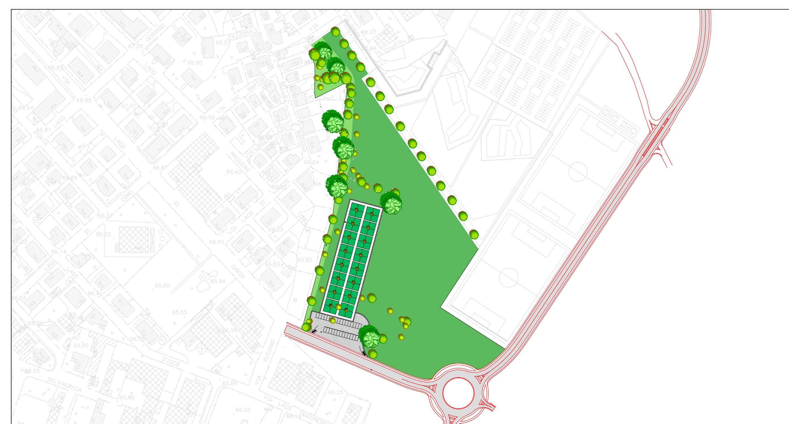
INQUADRAMENTO TERRITORIALE - 1:2000