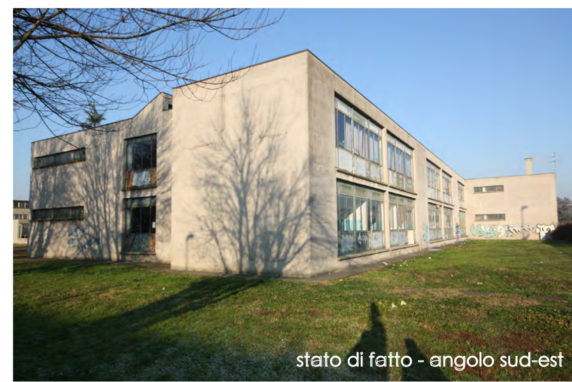
stato di fatto - angolo sud-est