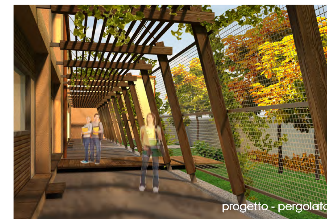
progetto - pergolato