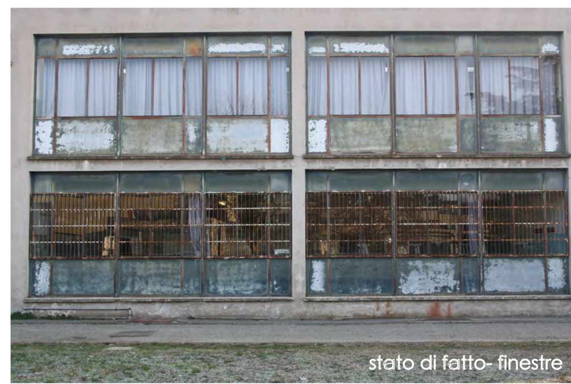
stato di fatto - finestre