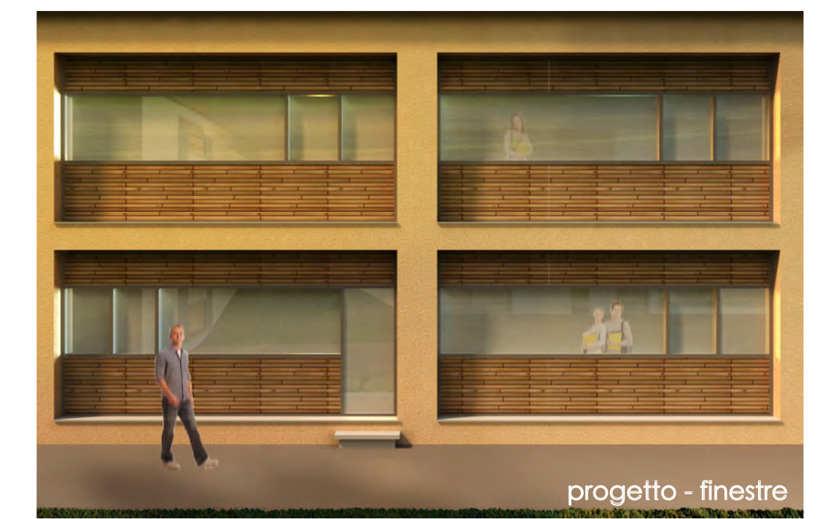
progetto - finestre