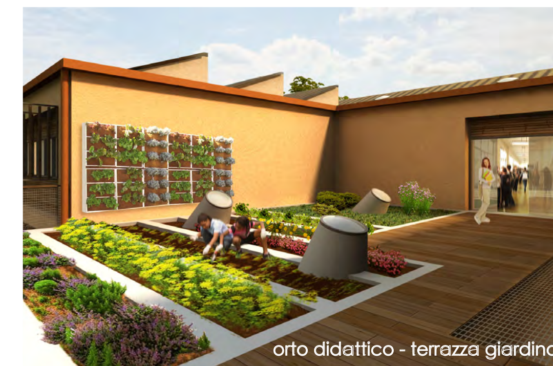
orto didattico - terrazza giardino