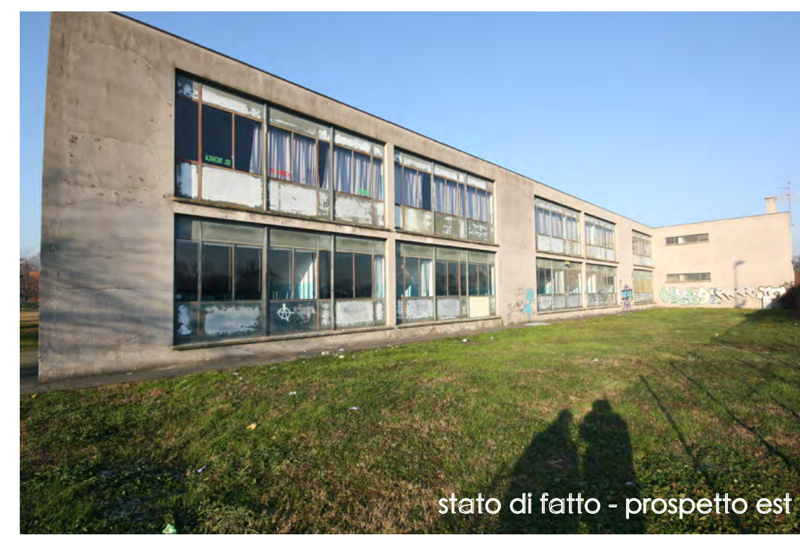
stato di fatto - prospetto est