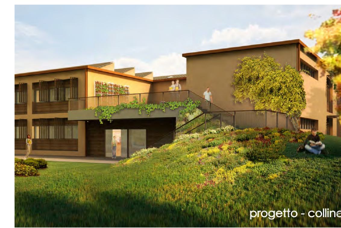
progetto - collina