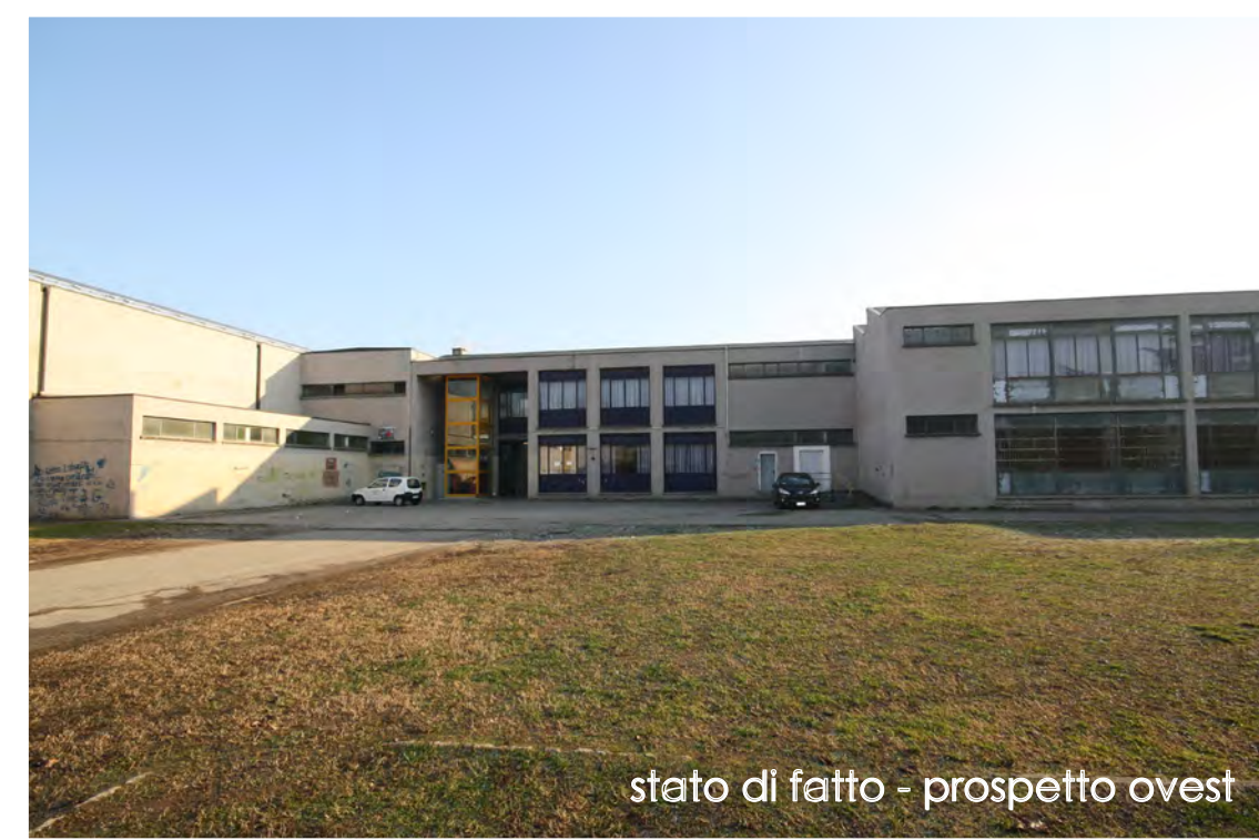
stato di fatto - prospetto ovest