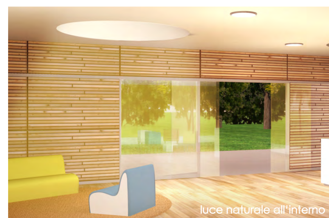
luce naturale all'interno