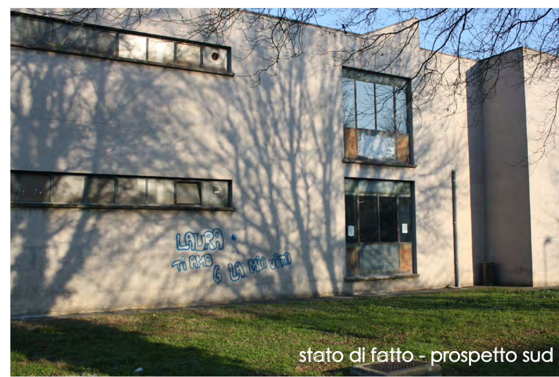
stato di fatto - prospetto sud