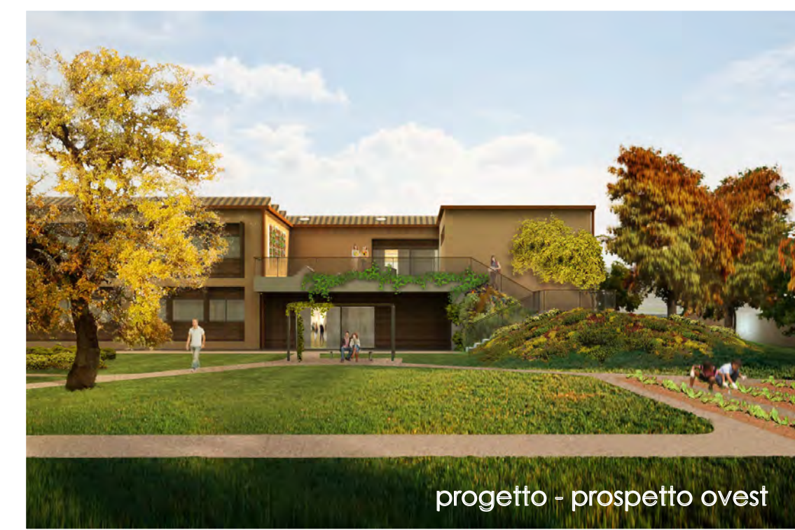
progetto - prospetto ovest