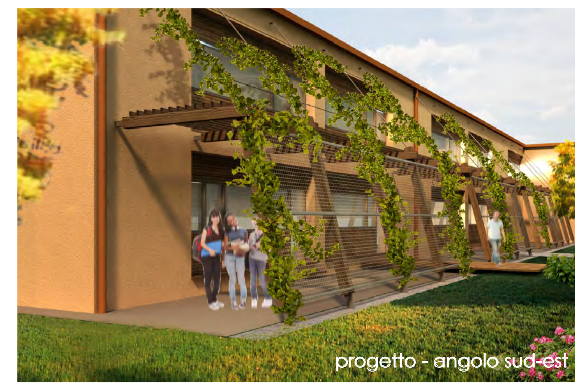
progetto - angolo sud-est