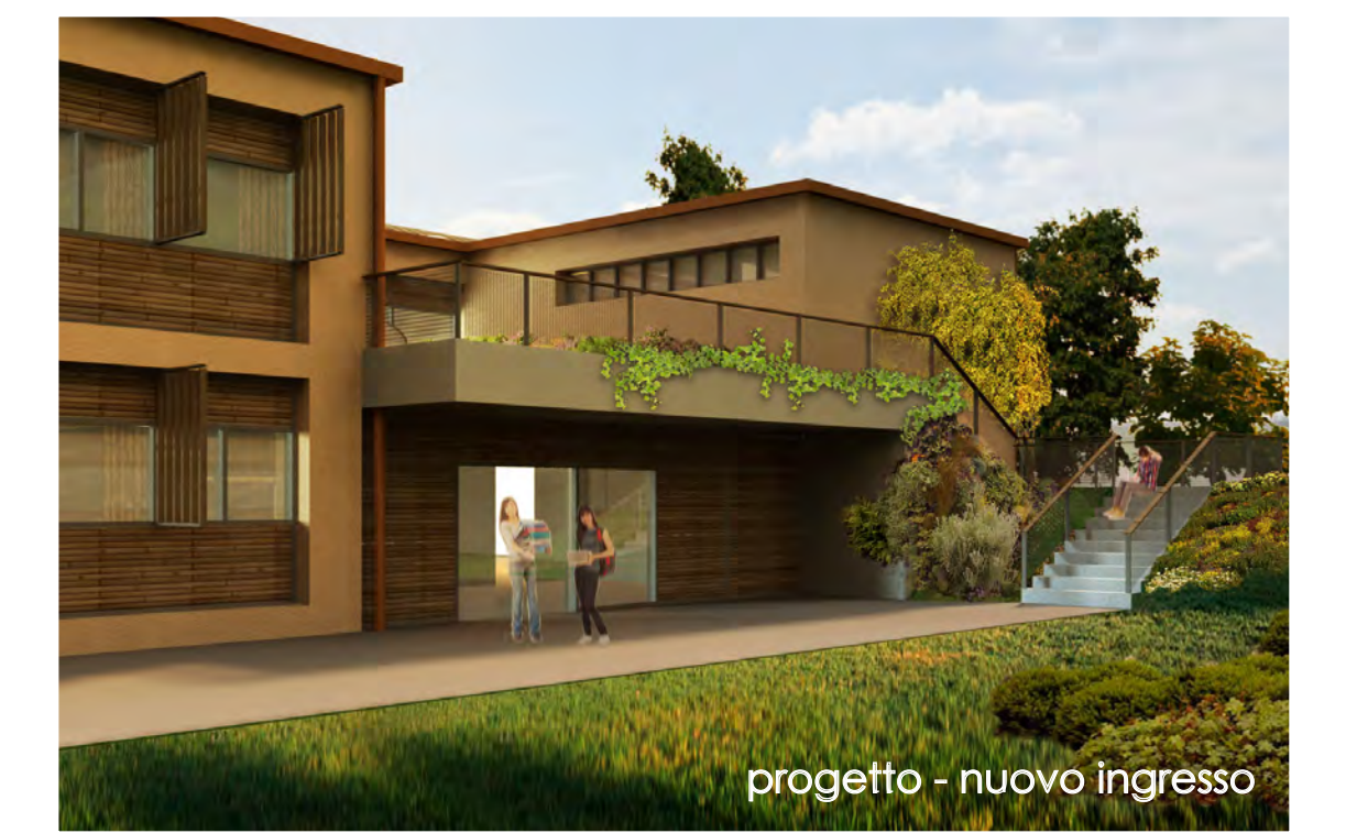
progetto - nuovo ingresso