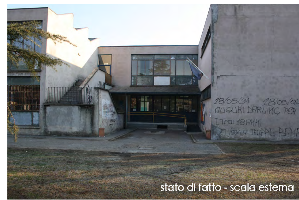
stato di fatto - scala esterna