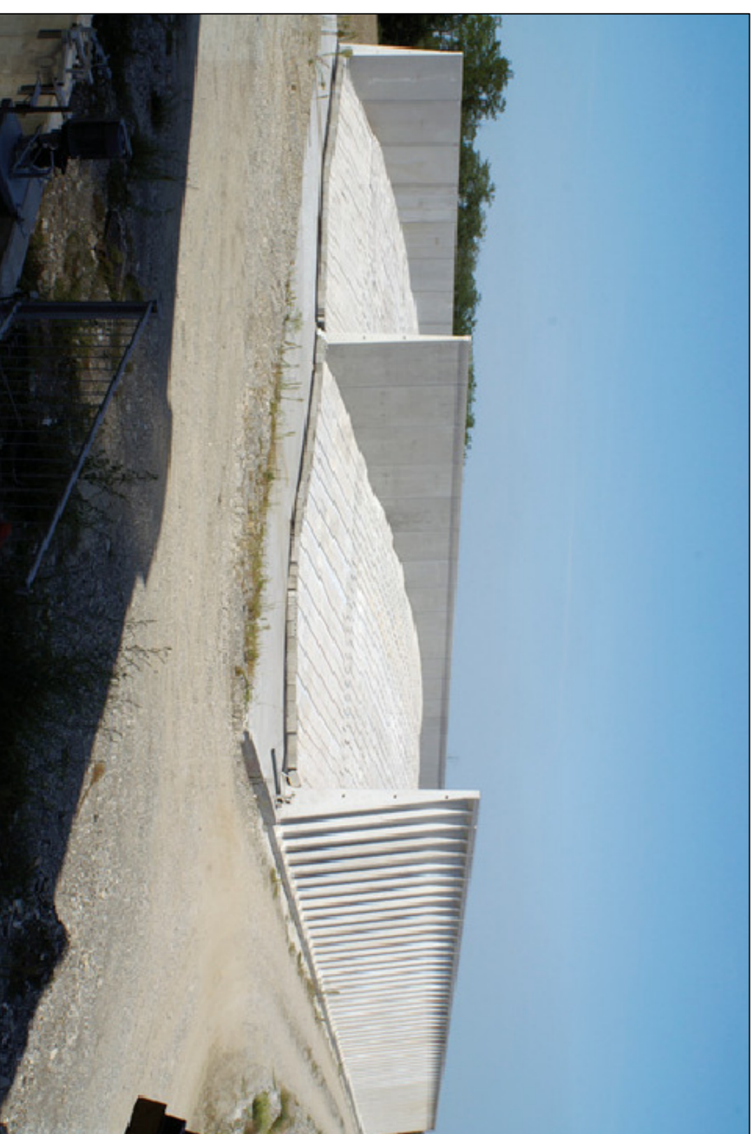
RAPPRESENTAZIONE INDICATIVA MA REALE DEI SILOS ORIZZONTALI IN OGGETTO