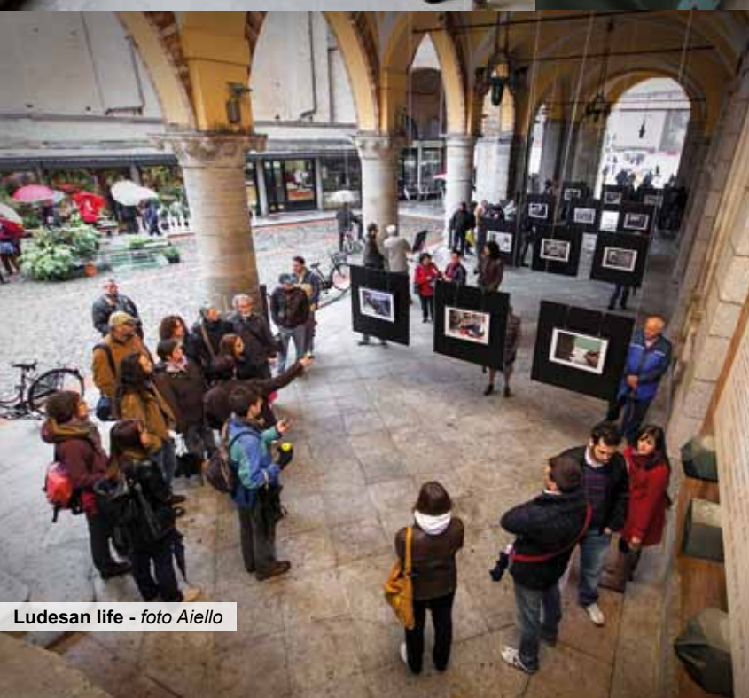
Ludesan life