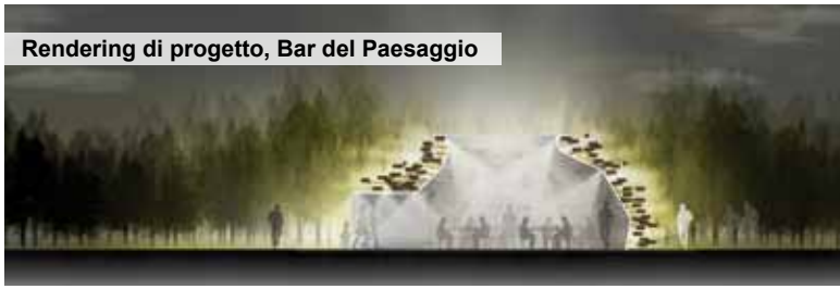
Rendering di progetto, Bar del Paesaggio

Partono le operazioni che condurranno a veder realizzato il nuovo "Bar del Paesaggio", la struttura di accoglienza e ristoro collocata nel contesto del Parco dell'Isolabella ed adiacente al parcheggio dell'Ospedale Maggiore in via Massena. Il Comune il 10 aprile scorso ha comunicato l'avvio della gara a procedura negoziata (D.Lgs 163/2006 ex art. 204 e successive modifiche ed integrazioni) per i lavori della nuova architettura, che sarà costruita in riva destra del fiume, nell'area della Grande Foresta di Pianura. La base d'asta è di circa 293.000 euro. Anche in tal caso, l'amministrazione comunale ha deciso che, a livello di gestione del locale, sarà poi replicata la soluzione concorsuale scelta per l'assegnazione avvenuta di recente nel caso della Bicistazione e della Ciclofficina in corso di realizzazione nei pressi della Stazione Ferroviaria, introducendo cioè un'importante facilitazione a favore dell'imprenditoria giovanile, grazie all'ammissione in gara anche di persone 'under 35' non ancora iscritte alla Camera di Commercio.