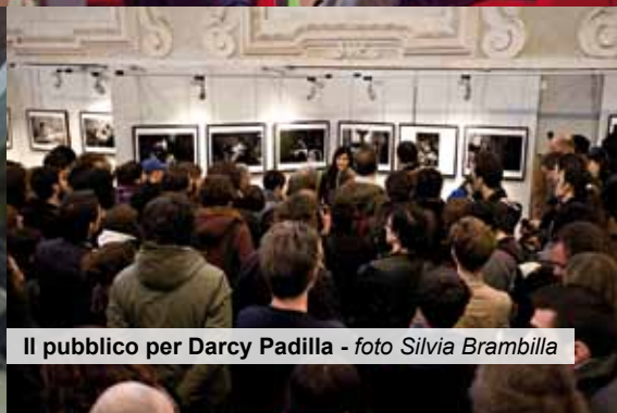
Il pubblico per Darcy Padilla