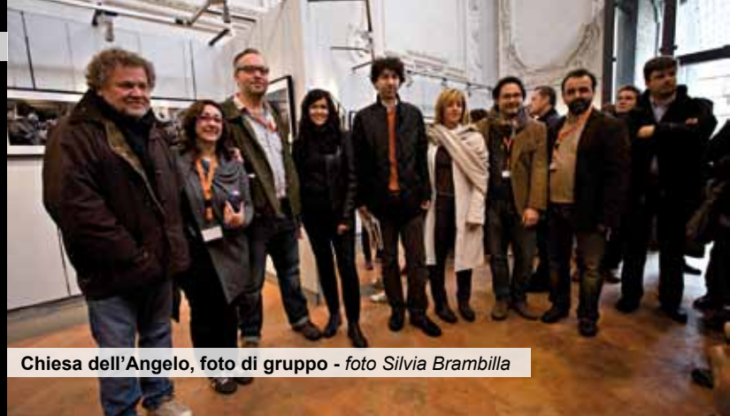
Chiesa dell'Angelo, foto di gruppo - foto Silvia Brambilla