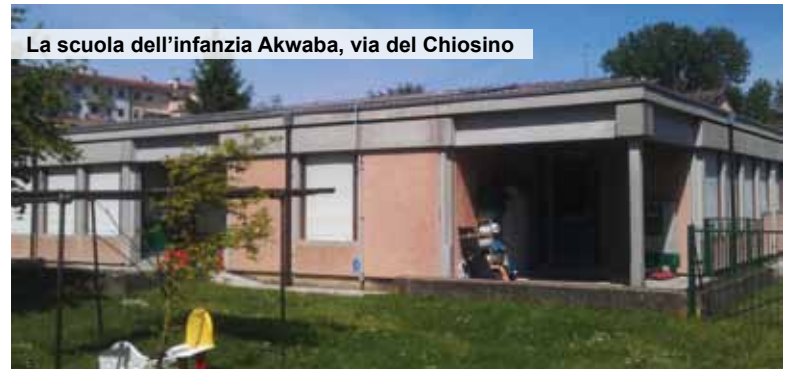
La scuola dell'infanzia Akwaba, via del Chiosino

In programma la riqualificazione energetica e la rimozione dell'amianto