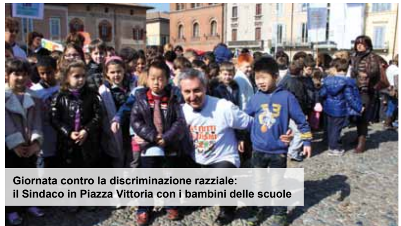
Giornata contro la discriminazione razziale: il Sindaco in Piazza Vittoria con i bambini delle scuole