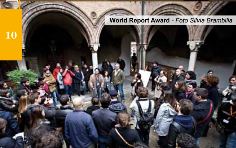
World Report Award