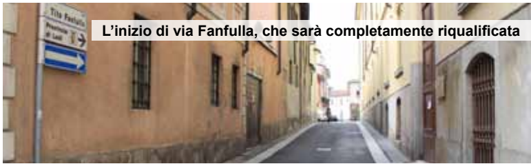
L'inizio di via Fanfulla, che sarà completamente riqualificata

Il progetto riguarda via Fanfulla, Battaggio, S. Maria del Sole, C. Piazza, Solferino e Magenta