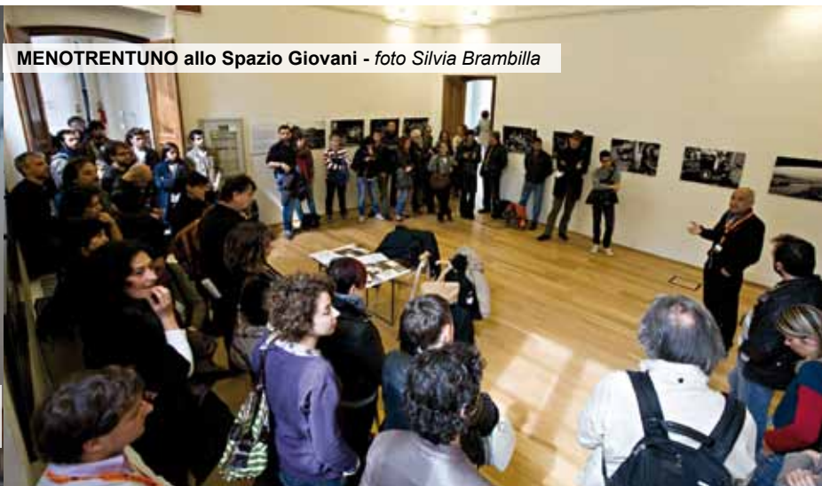
MENOTRENTUNO allo Spazio Giovani