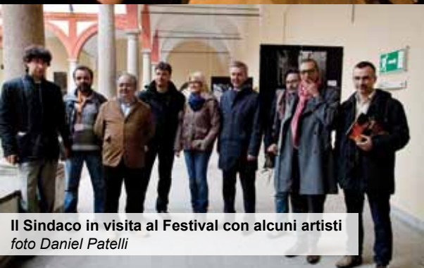
Il Sindaco in visita al Festival con alcuni artisti