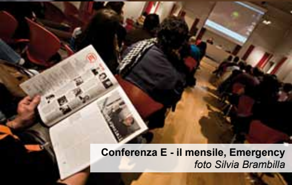
Conferenza E - il mensile, Emergency