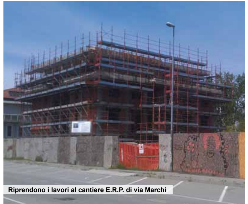
Riprendono i lavori al cantiere E.R.P. di via Marchi

17 appartamenti, previsto anche un nuovo parcheggio pubblico