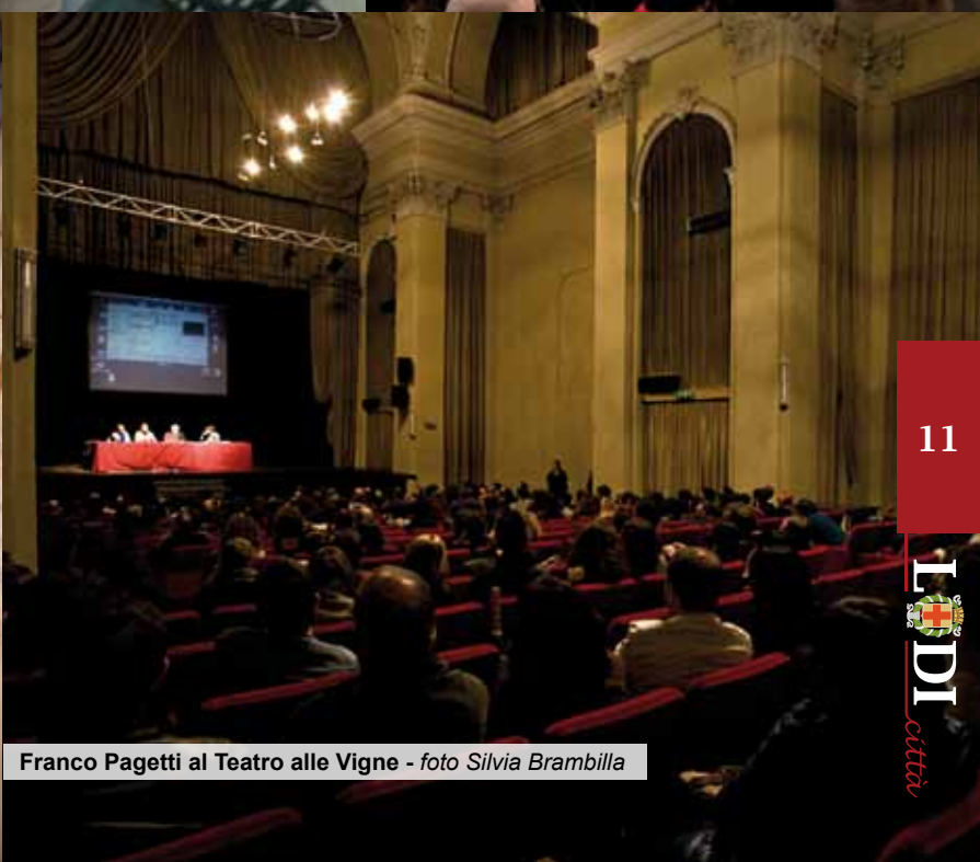
Franco Pagetti al Teatro alle Vigne