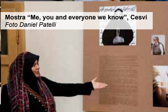
Mostra "Me, you and everyone we know", Cesvi