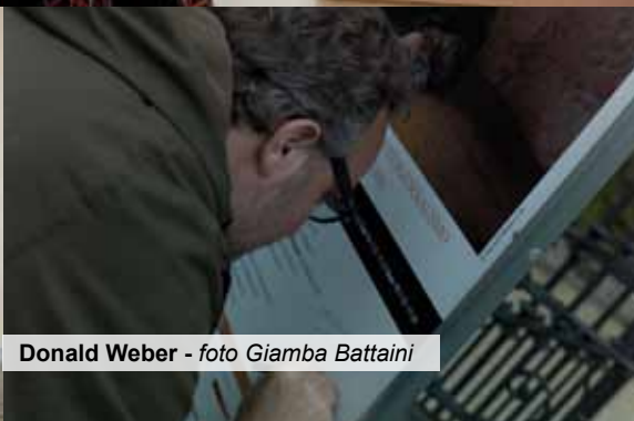
Donald Weber