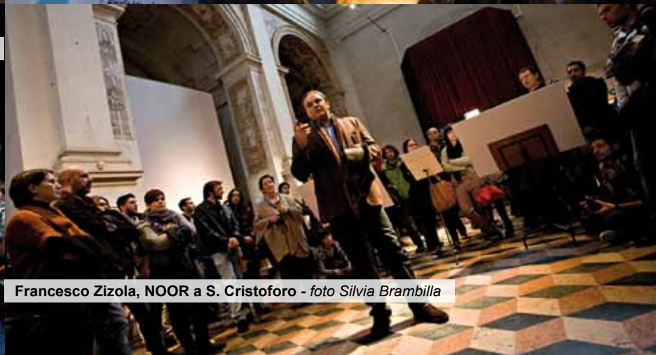
Francesco Zizola, NOOR a S. Cristoforo