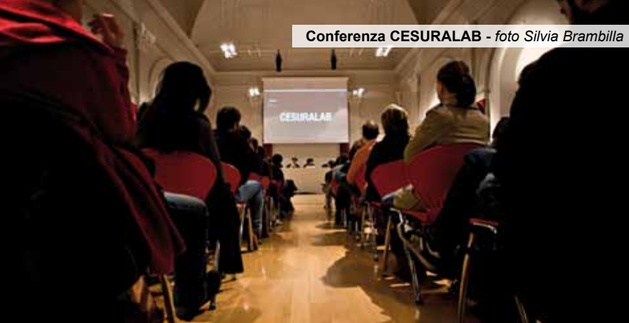
Conferenza CESURALAB