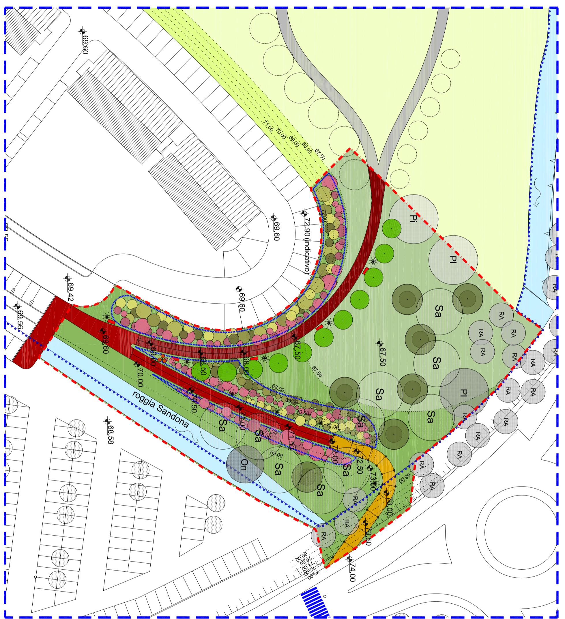
particolare 2 - scala 1:5'00