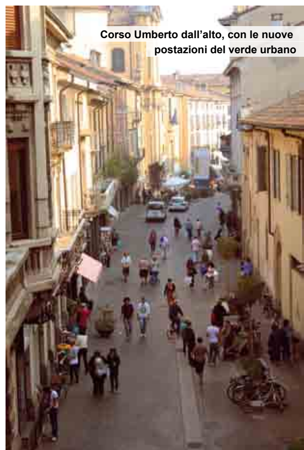
Corso Umberto dall'alto, con le nuove postazioni del verde urbano

Ad oggi il Comune sta solo muovendo alcuni passi per conoscere e decidere, tenendo fermo il passaggio delle corriere in Centro.