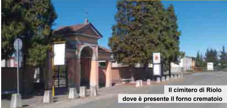
Il cimitero di Riolo dove è presente il forno crematoio