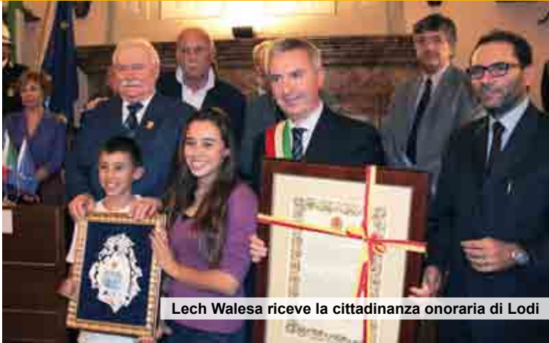
Lech Walesa riceve la cittadinanza onoraria di Lodi