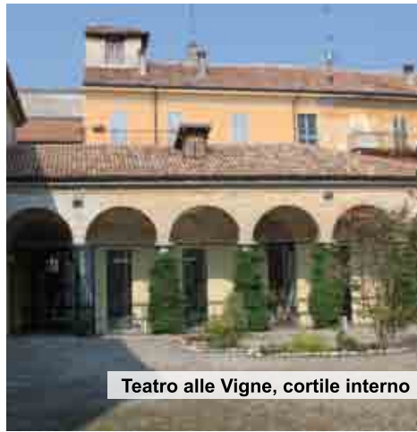
Teatro alle Vigne, cortile interno