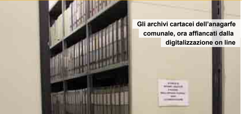
Gli archivi cartacei dell'anagrafe comunale, ora affiancati dalla digitalizzazione on line

L'intensa attività che si svolge presso il forno di Riolo attesta così la validità della scelta compiuta dall'amministrazione comunale, che tra il 2009 ed il 2010 ha sottoposto la struttura ad un sostanziale rifacimento per un costo di oltre 400.000 euro, compreso il nuovo impianto di depurazione dei fumi. Insieme all'ampliamento del cimitero di San Bernardo, che ha comportato un investimento di 1.500.000 euro, l'ammodernamento del forno crematorio è stato il principale intervento degli ultimi anni sulle strutture ed i servizi cimiteriali. Si è trattato senz'altro di una scelta opportuna ed in prospettiva, se si confermasse questa tendenza, per l'Amministrazione occorrerebbe riflettere sull'organizzazione degli spazi cimiteriali. Come noto, ad esclusione di alcune tombe di famiglia presso il cimitero Maggiore non c'è più disponibilità, a Riolo resta ancora qualche margine, mentre San Bernardo è stato quasi raddoppiato; ma guardando al futuro sarà sempre più difficile individuare aree di espansione. Sotto questo profilo una diffusione della pratica della cremazione gioverebbe senz'altro, richiedendo per la custodia delle ceneri spazi decisamente contenuti, oltre ad offrire oggettivi vantaggi in termini di sicurezza igienica e sanitaria.