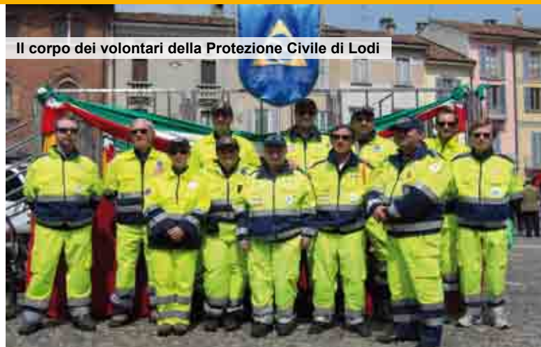
Il corpo dei volontari della Protezione Civile di Lodi

Spesso vengono effettuate prove di evacuazione di alcuni stabili, oppure esercitazioni e simulazioni.