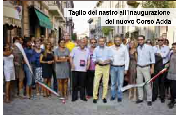
Taglio del nastro all'inaugurazione del nuovo Corso Adda

Spettinatissimi ACCONCIATURE UOMO • DONNA