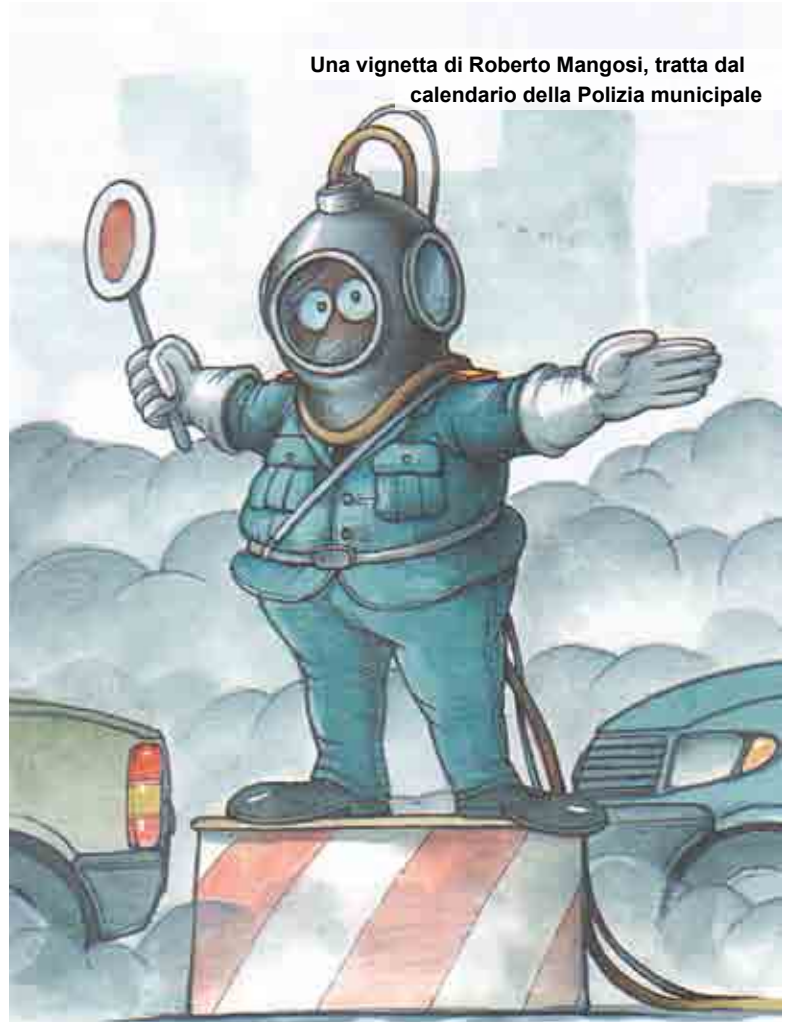
Una vignetta di Roberto Mangosi, tratta dal calendario della Polizia municipale

Il fermo si applica su tutti i tratti stradali ricadenti all'interno delle Zone indicate, comprese le strade provinciali e statali ad esclusione delle autostrade, strade di interesse regionale R1, tratti di collegamento tra le autostrade e le strade R1 e gli svincoli delle stesse e i tratti di collegamento ai parcheggi posti in corrispondenza delle stazioni periferiche dei mezzi pubblici o delle stazioni ferroviarie.