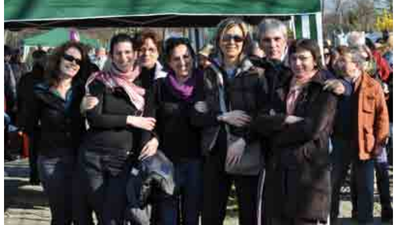
Una recente giornata sull'Adda all'insegna dell'integrazione e del dialogo

famiglie, in un processo che interesserà trasversalmente molti ambiti di vita. In questo ampio progetto il ruolo della Consulta si svilupperà esercitando competenze che vanno dalla presentazione di proposte alla promozione di iniziative, dalla sensibilizzazione al coinvolgimento dei cittadini, dalla cooperazione con gli organi comunali all'informazione.