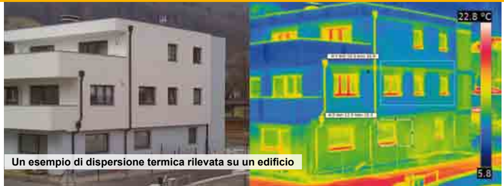
Un esempio di dispersione termica rilevata su un edificio

si è tradotta in un risparmio notevole (34% rispetto agli anni precedenti), pari a circa 36.000 metri cubi di gas: le spese di riscaldamento della scuola si riducono di 24.000 euro l'anno.